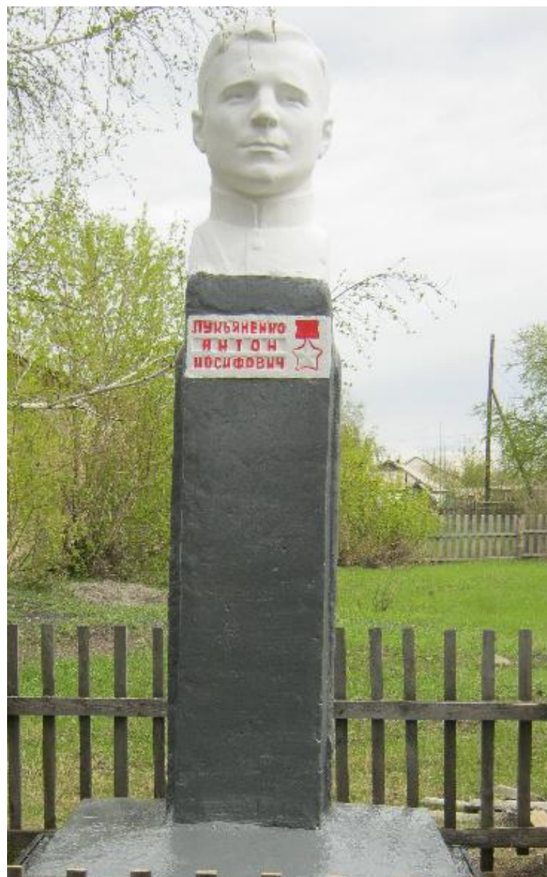
Памятник Герою Советского Союза А.И. Лукьяненко, пос. Андреевка