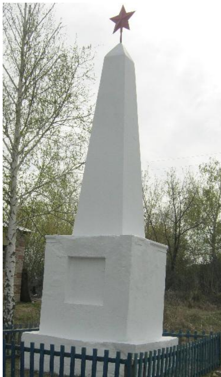
Обелиск воинам, погибшим в годы Великой Отечественной войны, село Коробейниково