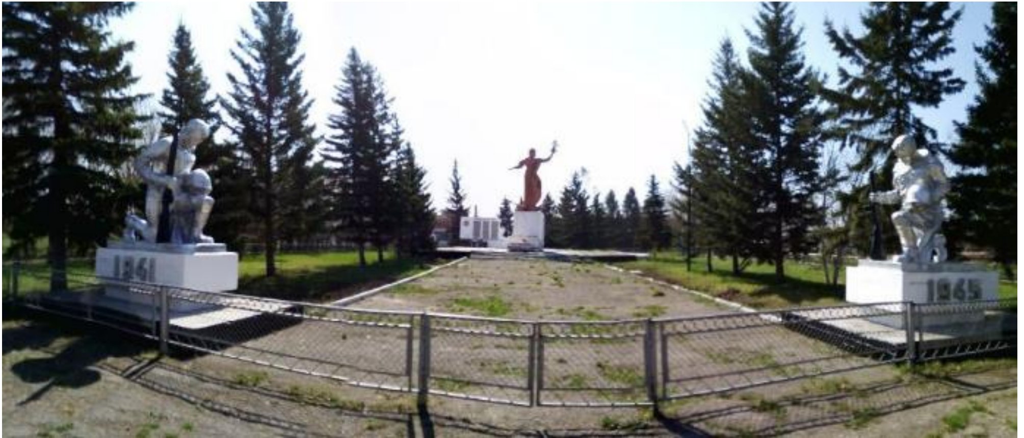
Мемориальный комплекс воинам, погибшим в годы Великой Отечественной войны, с. Хлопуново