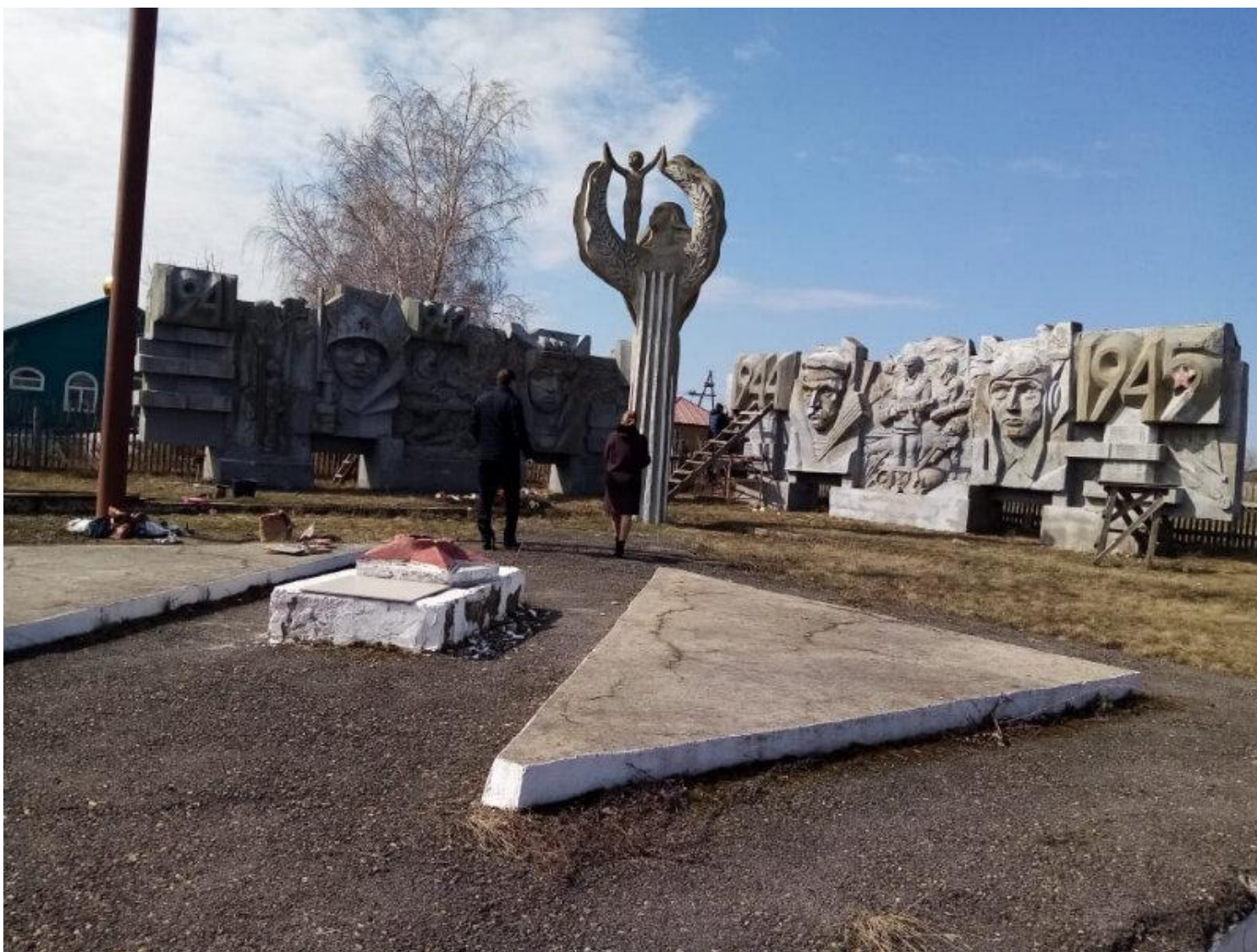
Мемориальный комплекс воинам, погибшим в годы Великой Отечественной войны, с. Самсоново