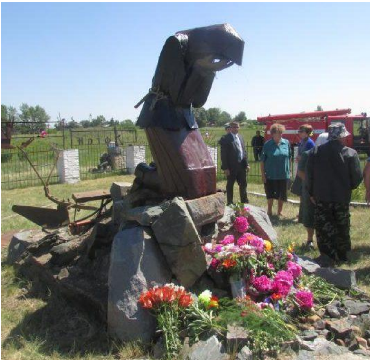
Мемориал «Прощание славянки», с. Белоглазово