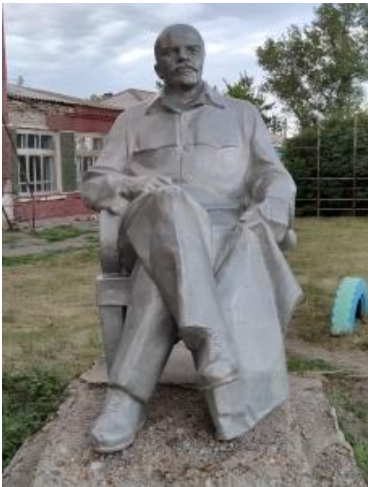
Памятник В.И. Ленину, с. Тугозвоново