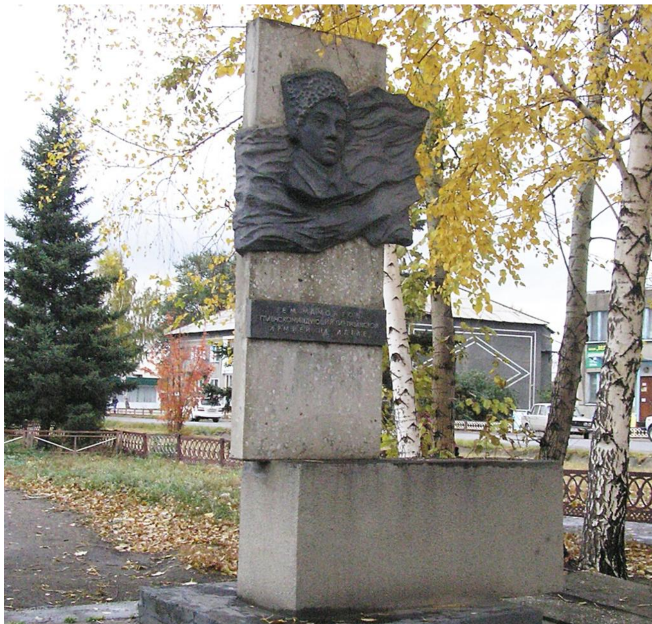
Обелиск в честь освобождения Шипуновского района от колчаковских банд