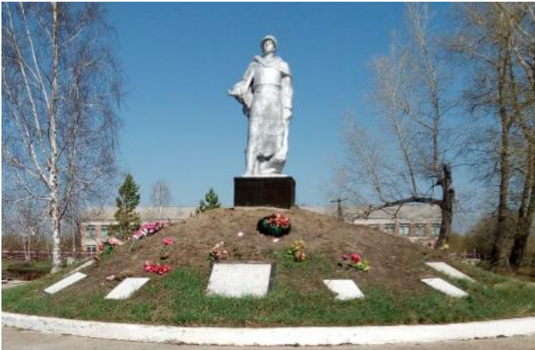
Мемориальный комплекс воинам, погибшим в годы Великой Отечественной войны, с. Бобровка