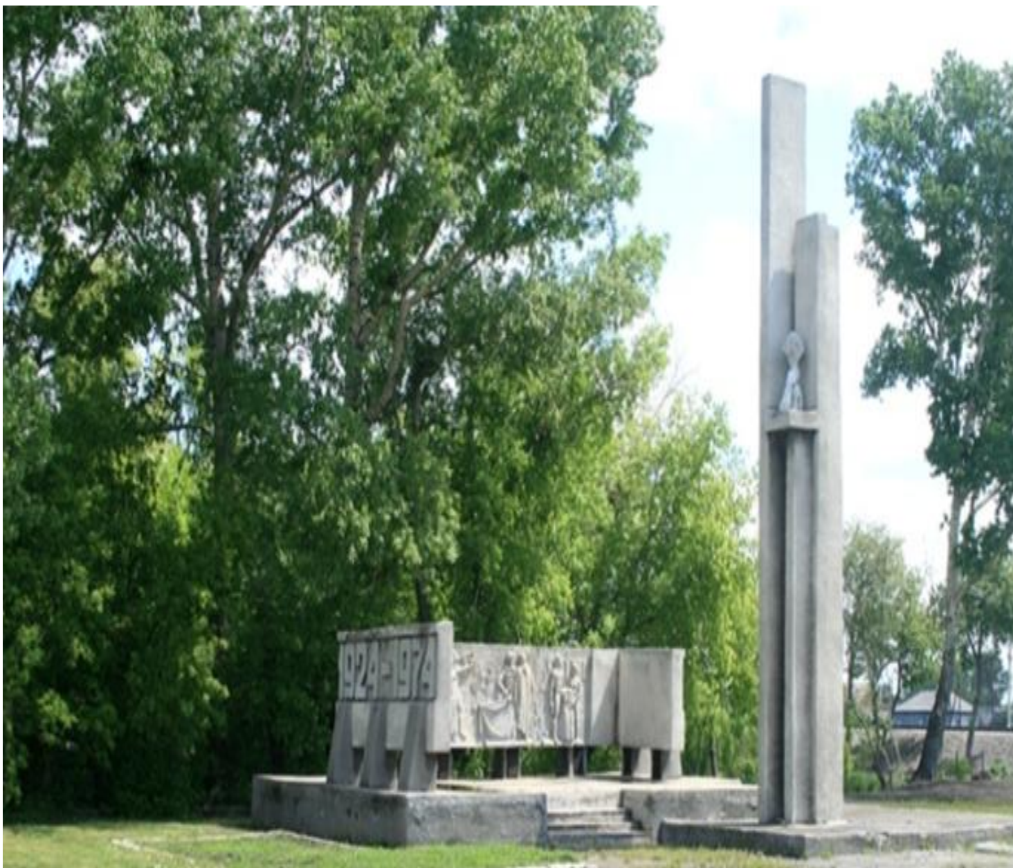
Памятник Трудовой Славы Шипуновского района