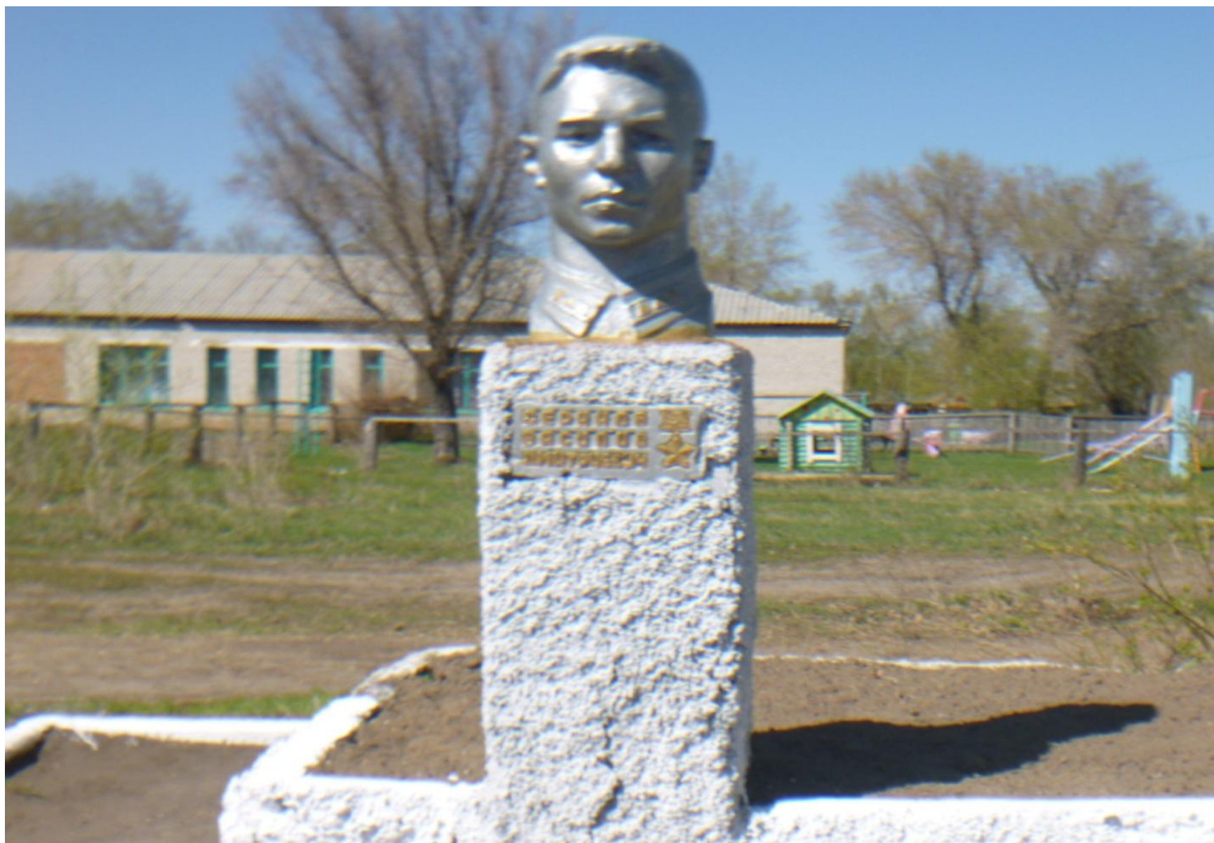
Памятник Герою Советского Союза В.Д. Серикову, с. Порожное