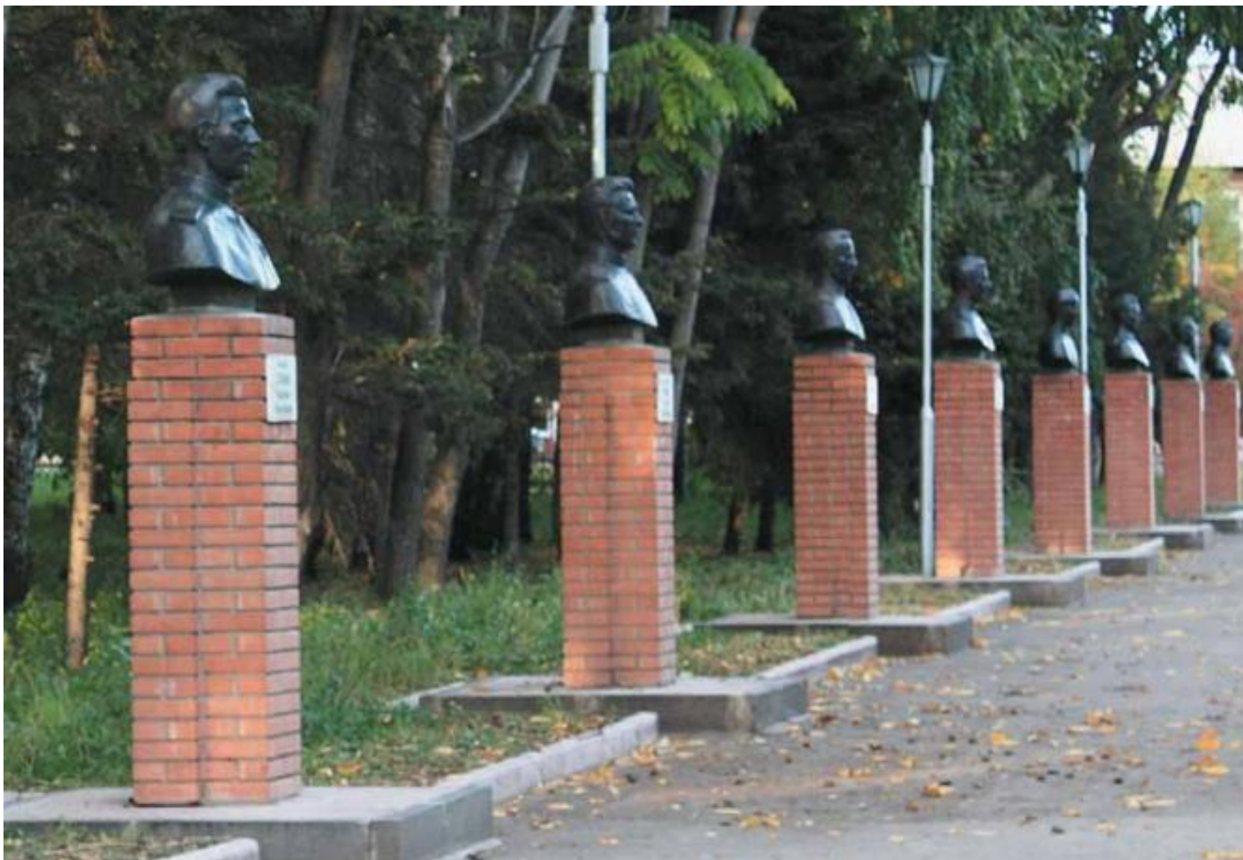
Бюсты десяти Героев Советского Союза