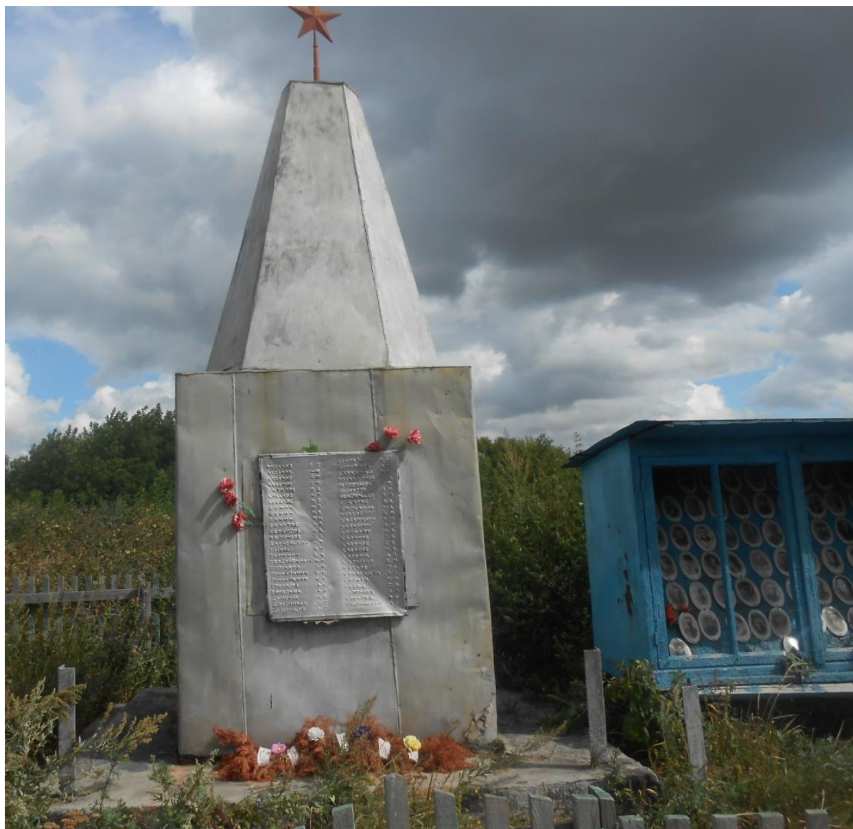
Обелиск воинам, погибшим в годы Великой Отечественной войны, с. Белоглазово