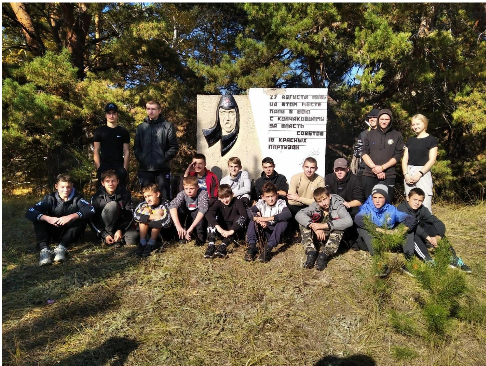
Памятник расположен на границе сел Урлапово и Зеркалы