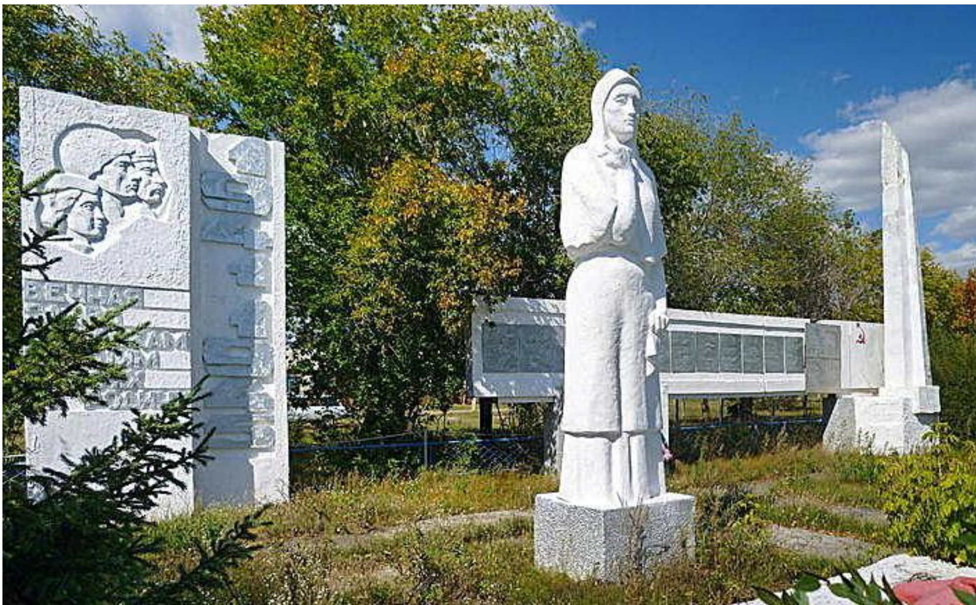
Мемориал землякам, павшим в боях за Родину, с. Быково