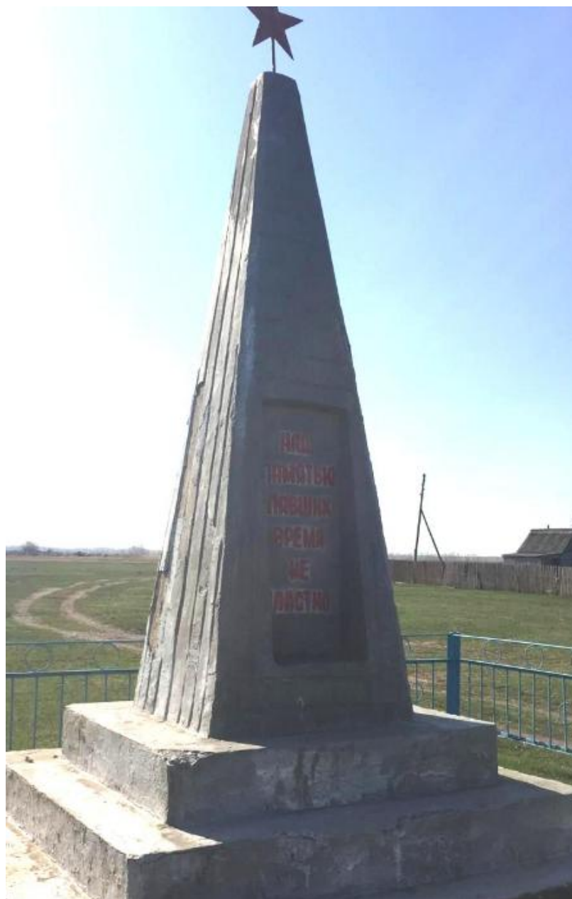
Обелиск воинам, погибшим в годы Великой Отечественной войны, село Кузнечиха