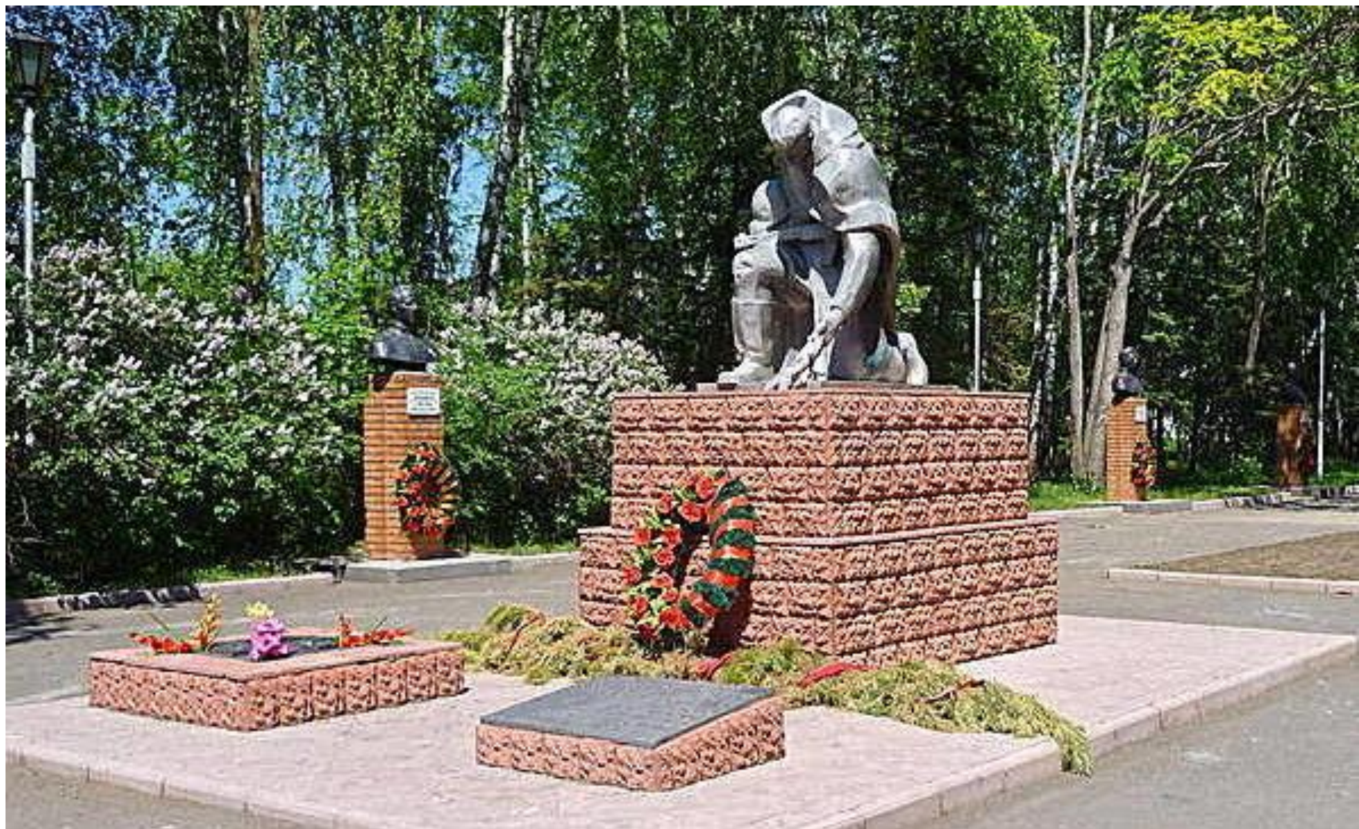
Памятник «Коленопреклоненному воину»