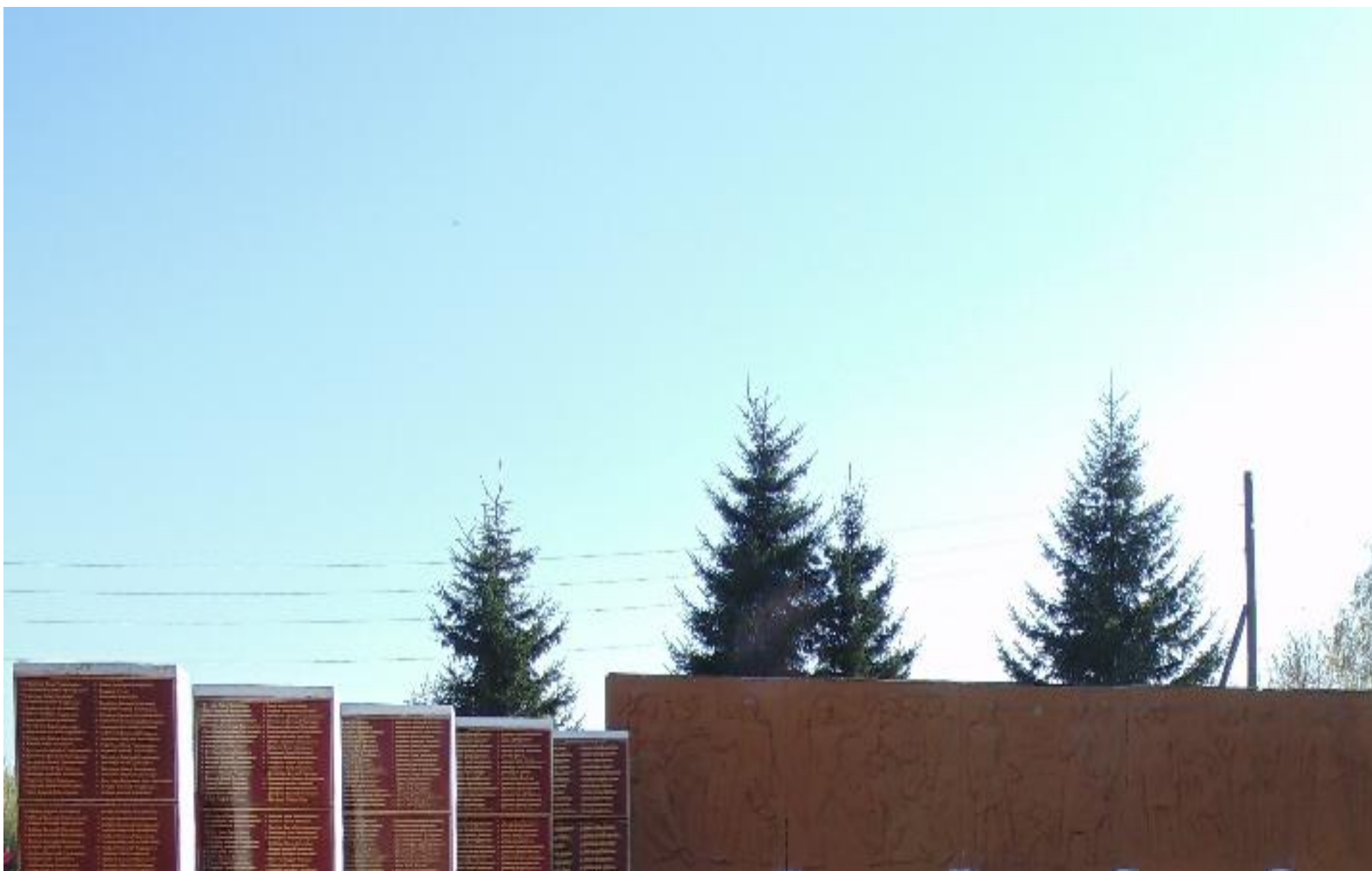
Мемориальный комплекс воинам, погибшим в годы Великой Отечественной войны, с. Нечунаево