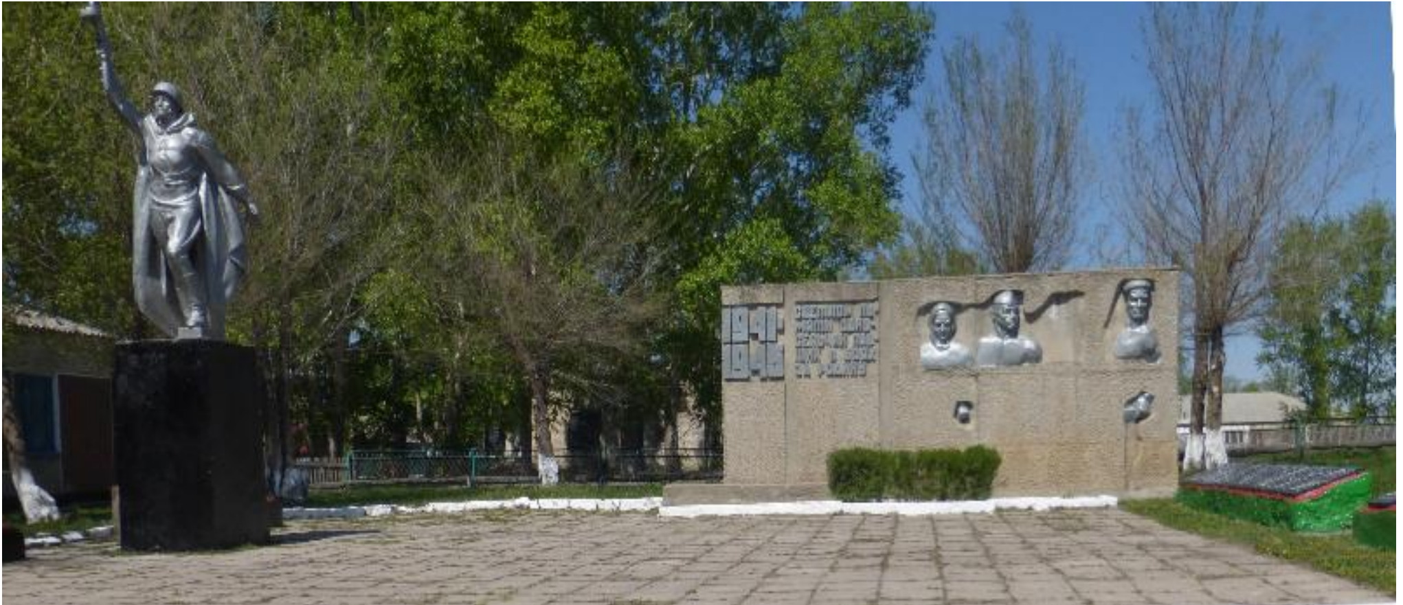
Мемориальный комплекс воинам, погибшим в годы Великой Отечественной войны, с. Комариха