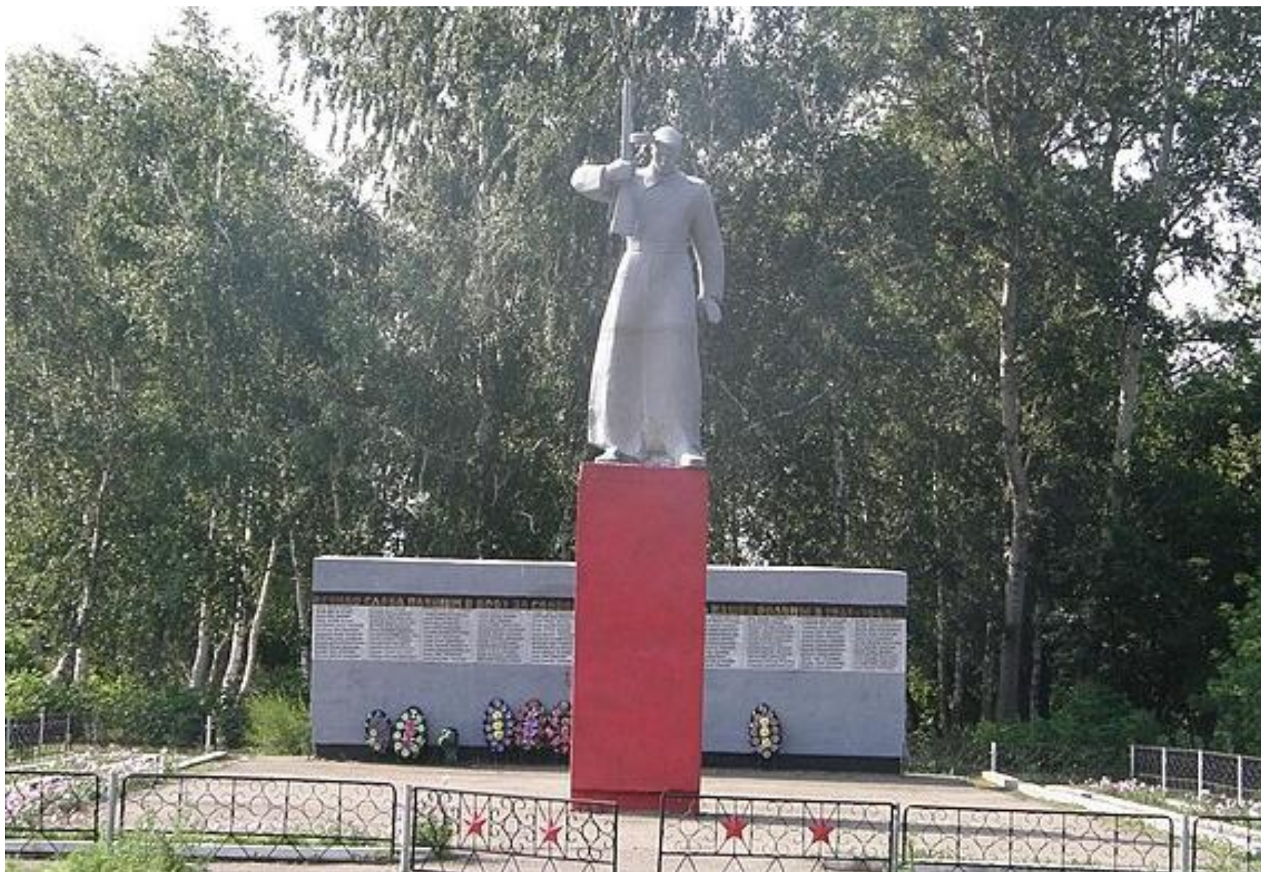
Мемориальный комплекс воинам, погибшим в годы Великой Отечественной войны, с. Урлапово