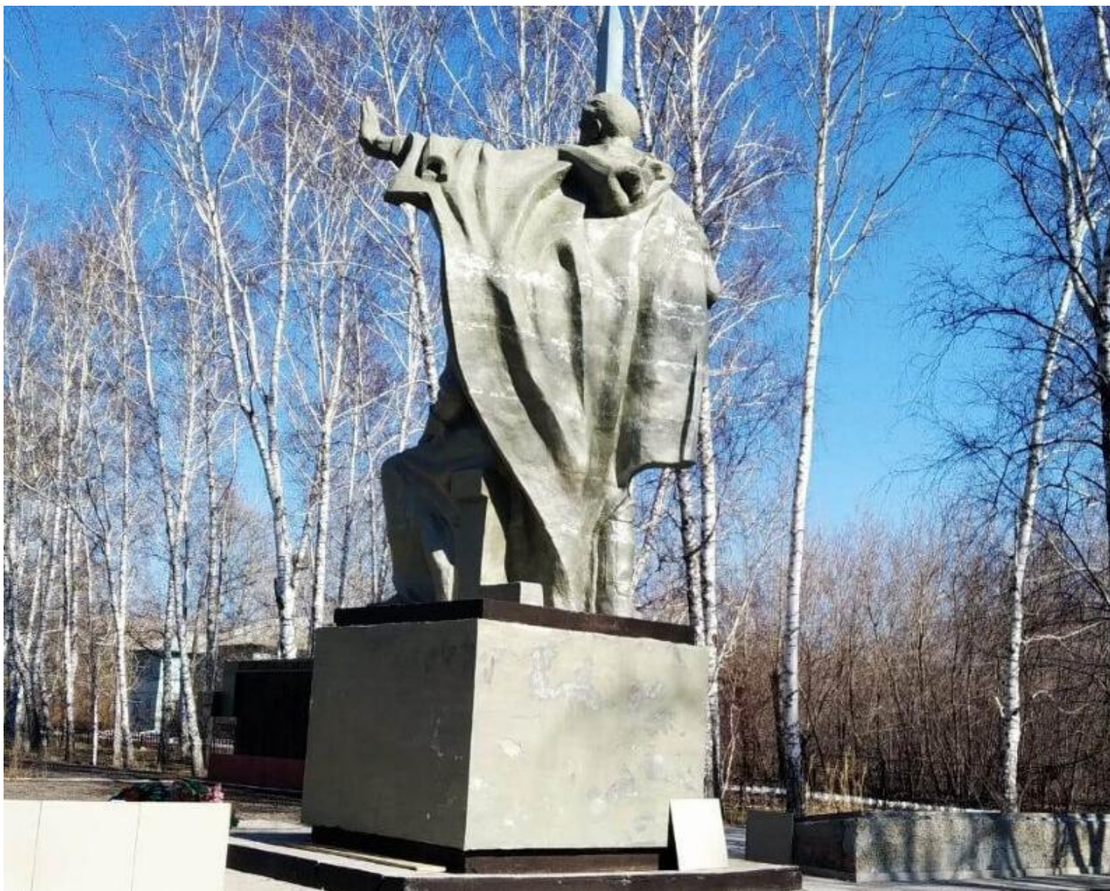
Мемориальный комплекс воинам, погибшим в годы Великой Отечественной войны в с. Горьковское