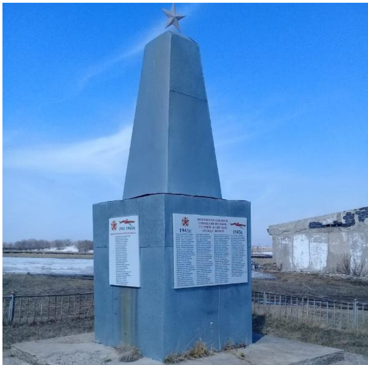
Обелиск воинам, погибшим в годы Великой Отечественной войны, село Ильинка