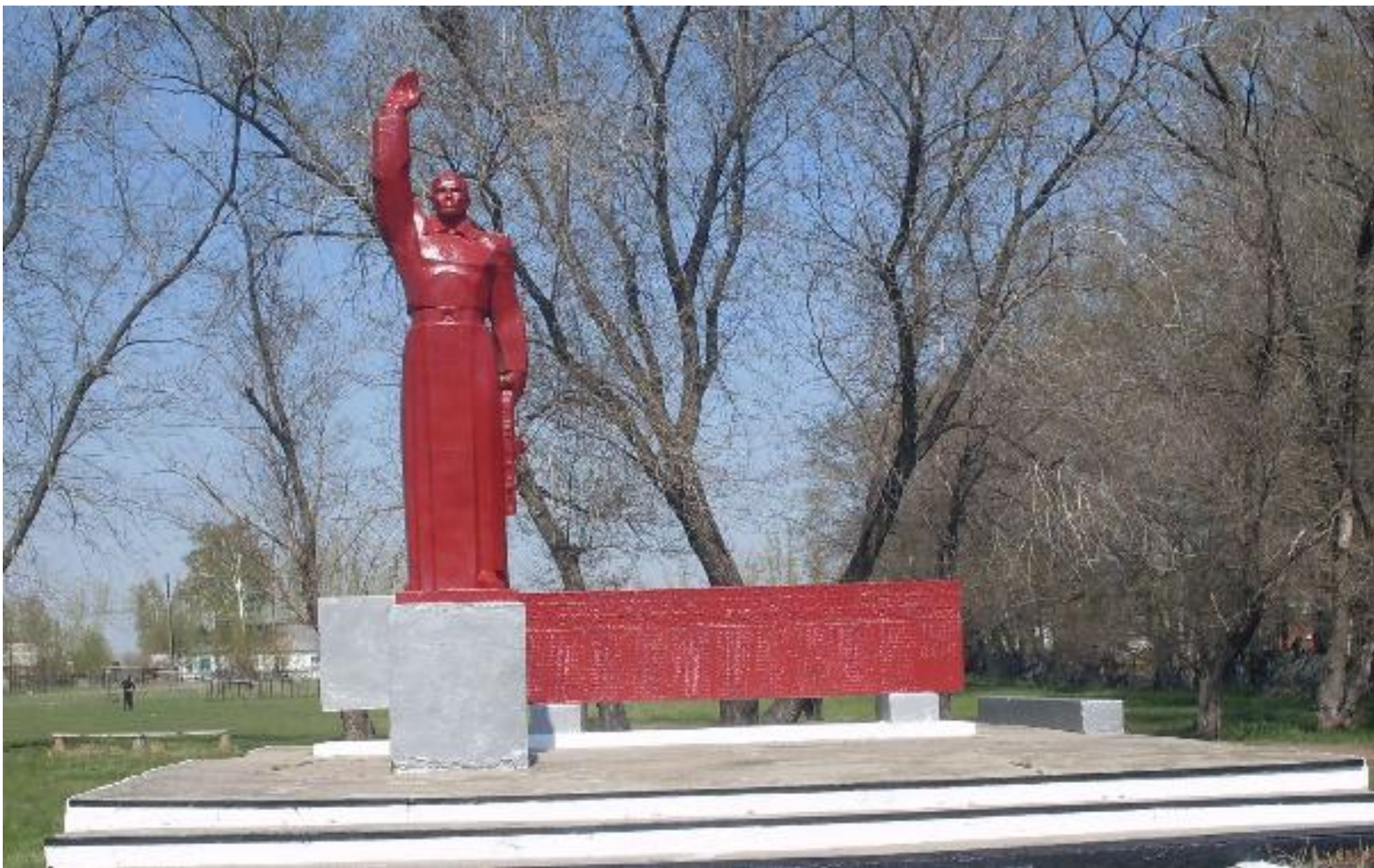
Мемориальный комплекс воинам, погибшим в годы Великой Отечественной войны, с. Шипуново-2