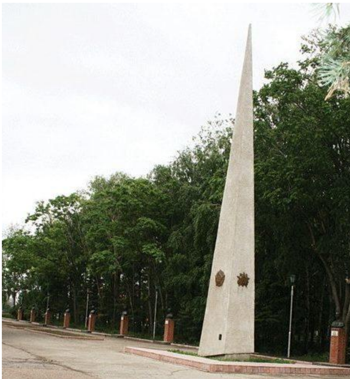
Вход на Алею Героев