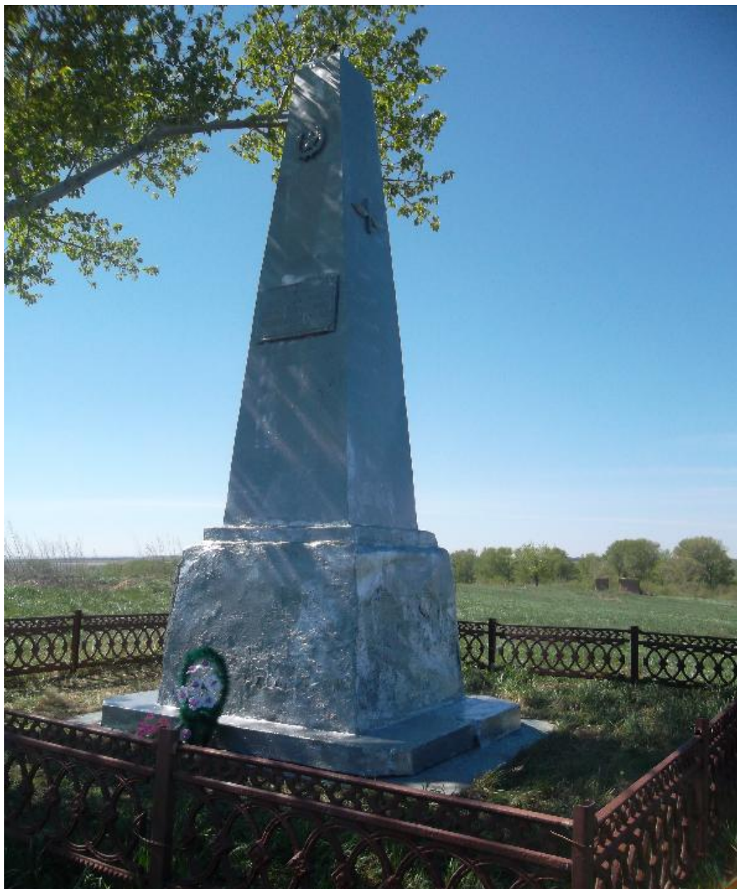
Обелиск воинам, погибшим в годы Великой Отечественной войны, поселок Дружба