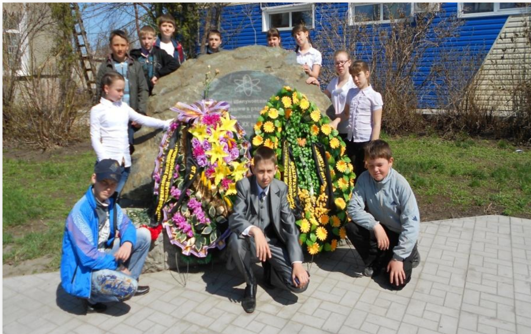
Памятник участникам ликвидации последствий аварии на Чернобыльской АЭС