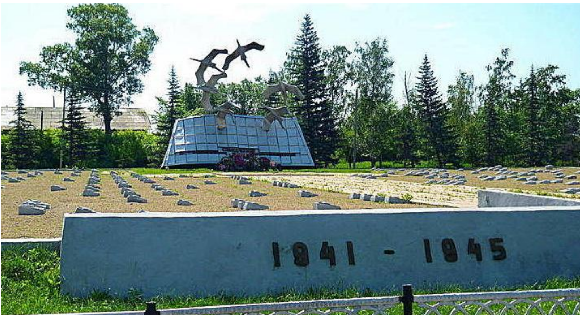
Мемориал «Солдатам, не вернувшимся с полей»