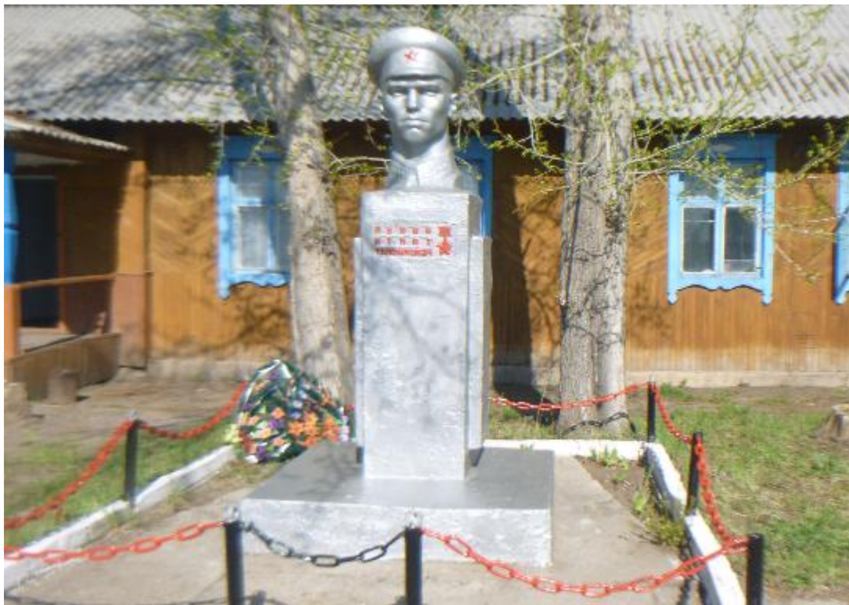
Памятник Герою Советского Союза И.Т. Рукину, участнику Великой Отечественной войны, с. Порожное