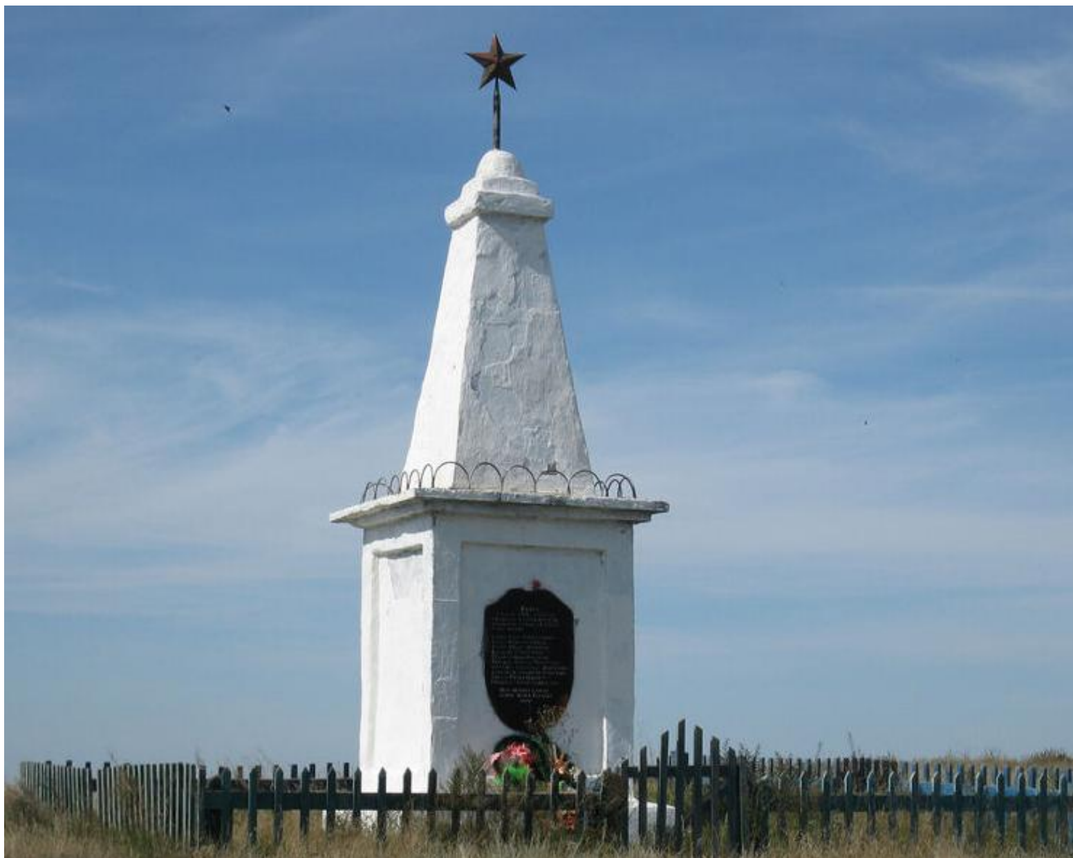
Братская могила 8 партизан, с. Белоглазово