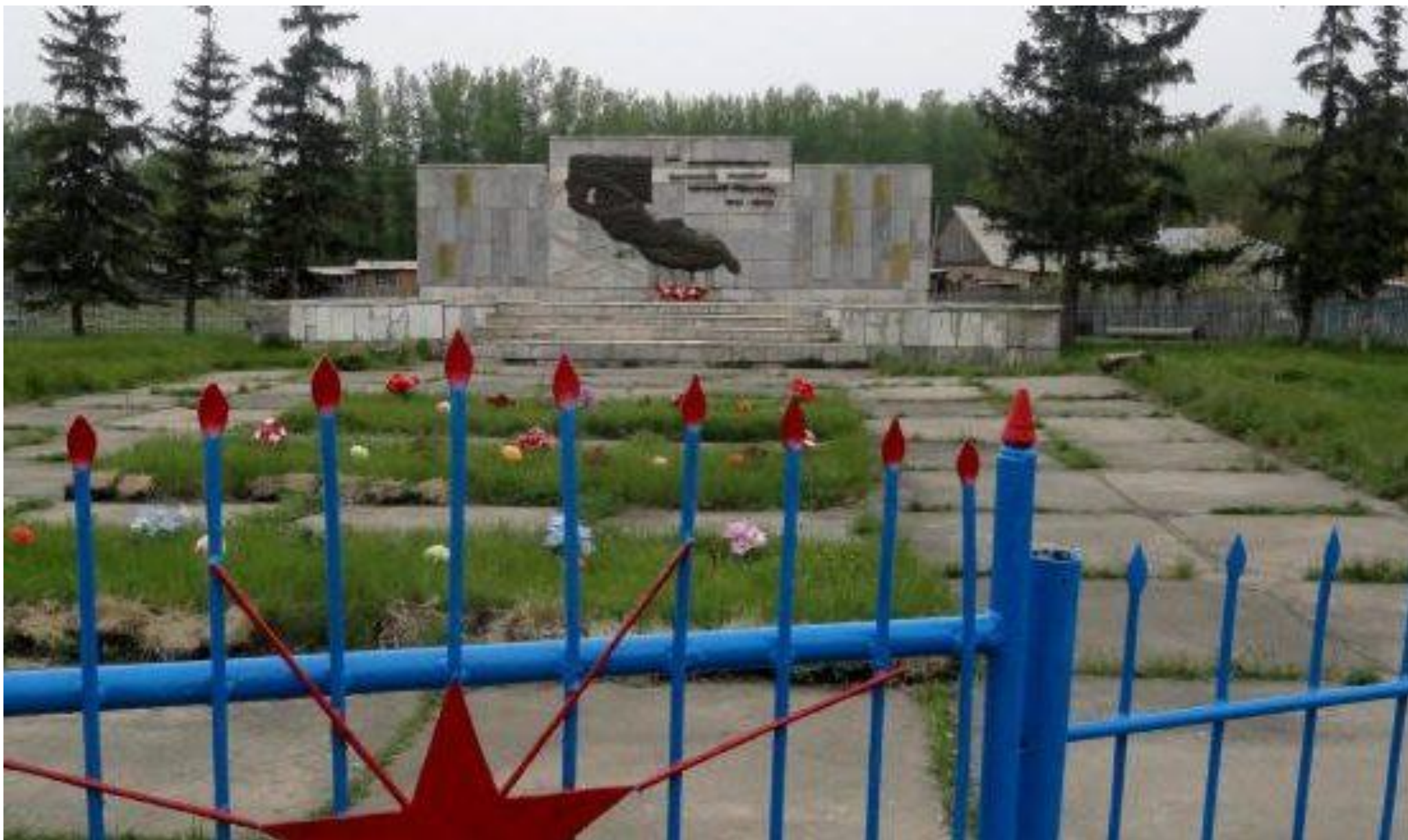
Мемориальный комплекс воинам, погибшим в годы Великой Отечественной войны, с. Ельцовка