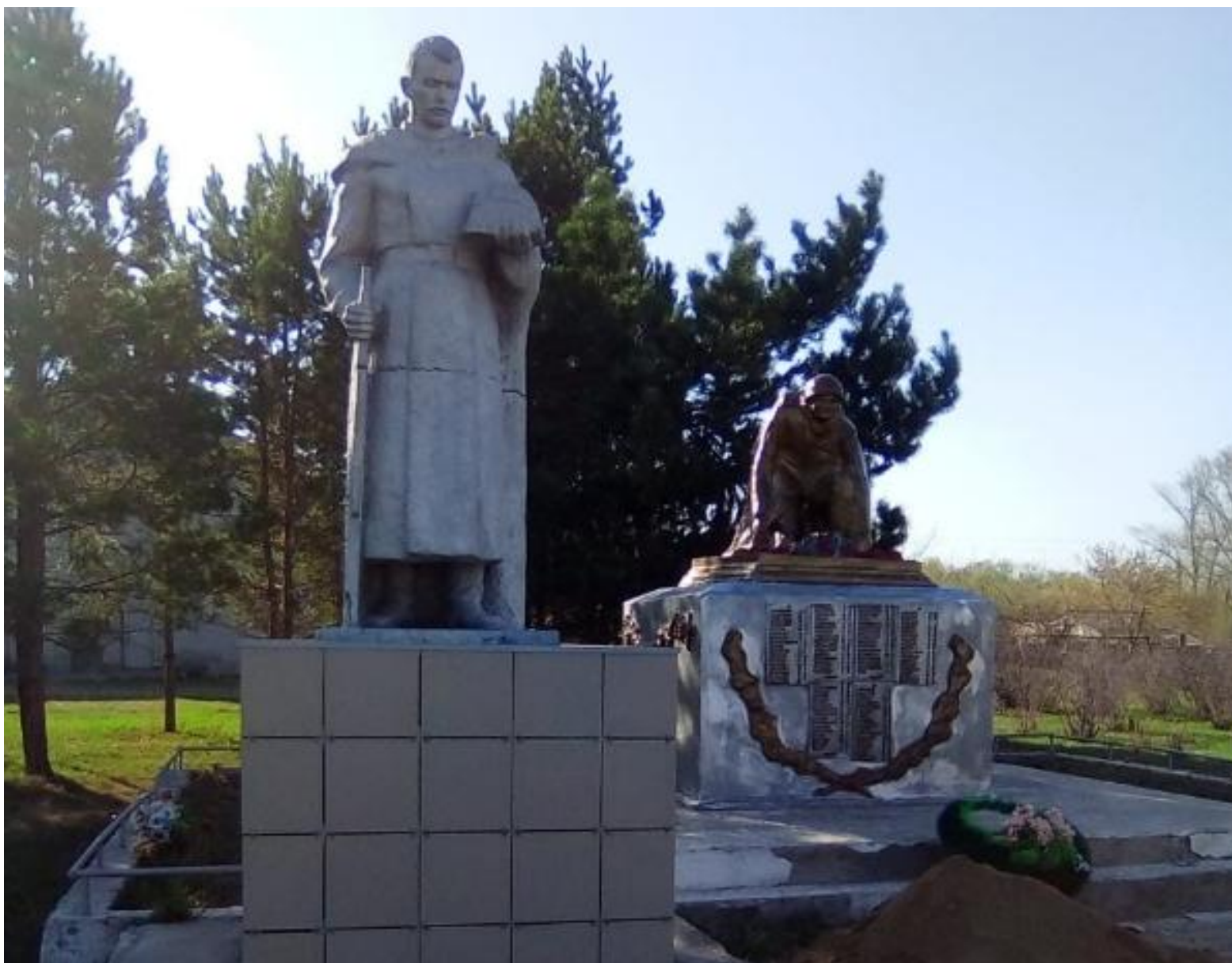
Мемориальный комплекс воинам, погибшим в годы Великой Отечественной войны, пос. Первомайский