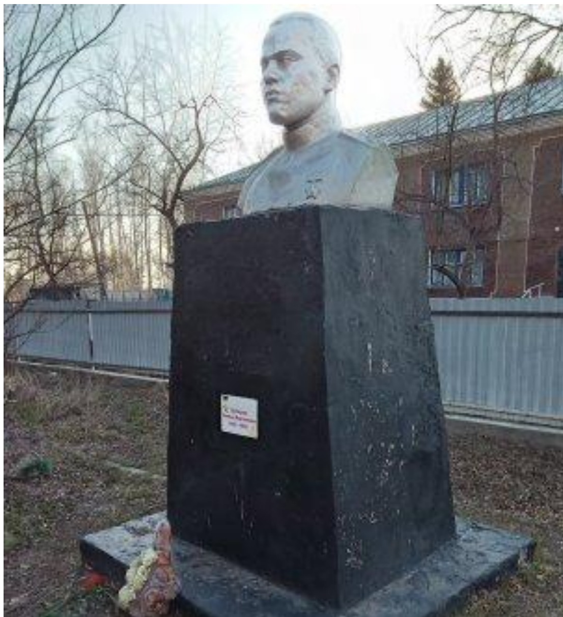
Памятник Герою Советского Союза Белоусову С.М., с. Красный Яр