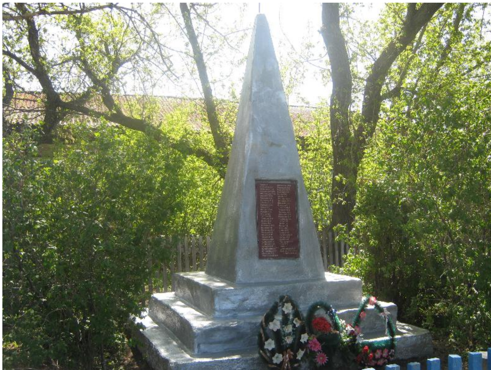
Обелиск воинам, погибшим в годы Великой Отечественной войны, с. Озерки