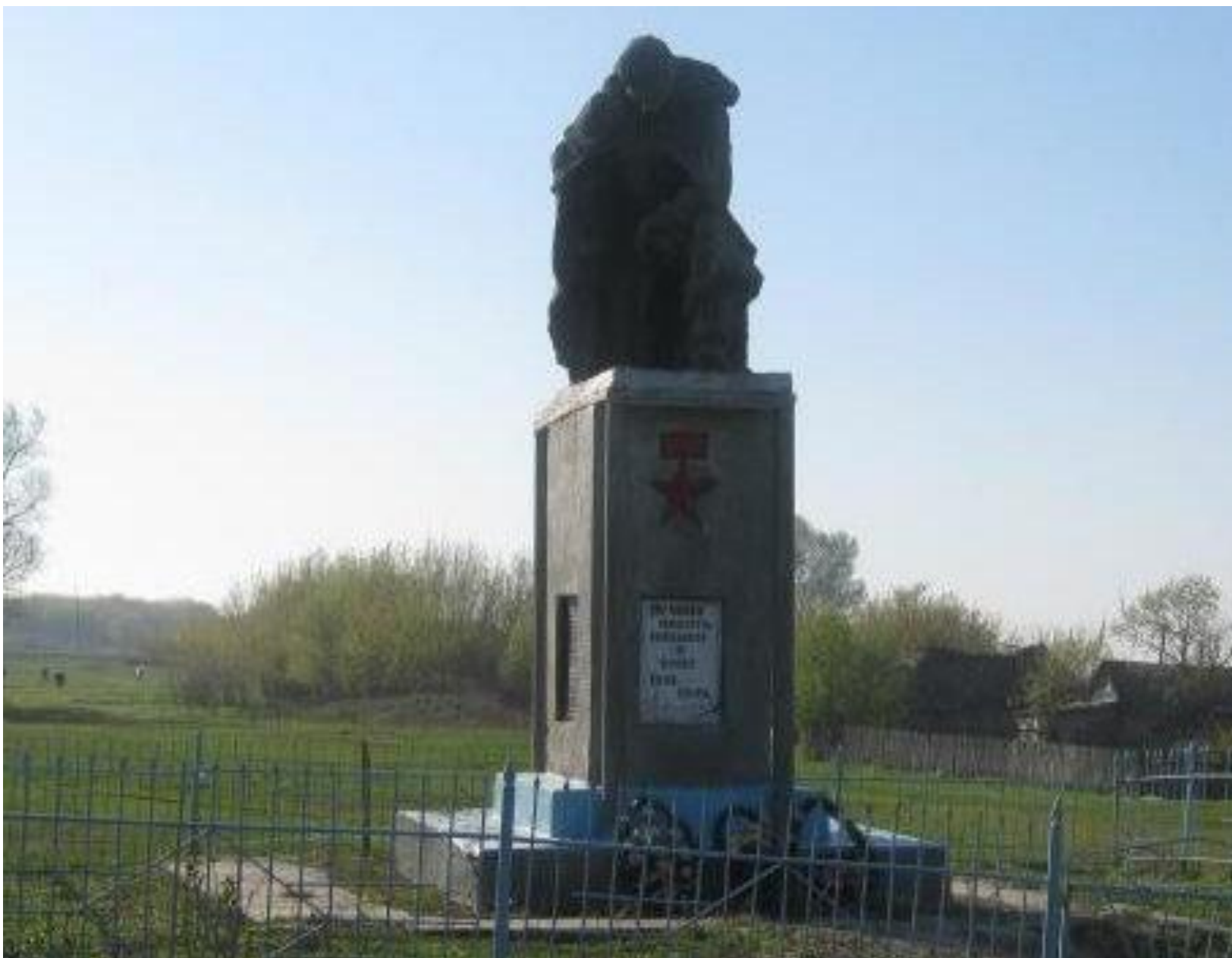
Памятник воинам, погибшим в годы Великой Отечественной войны, п. Качусово