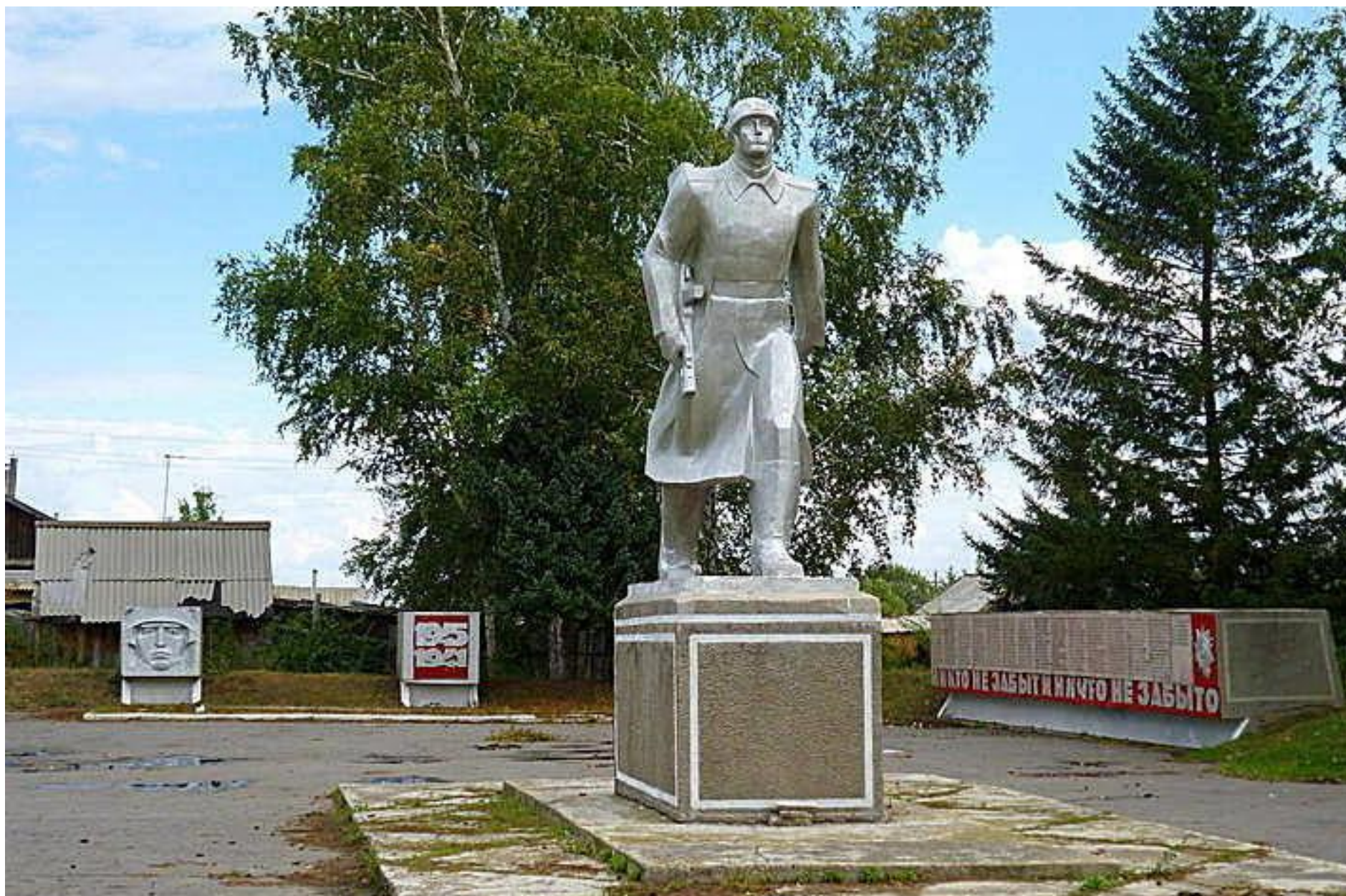
Мемориальный комплекс воинам, погибшим в годы Великой Отечественной войны, с. Родино