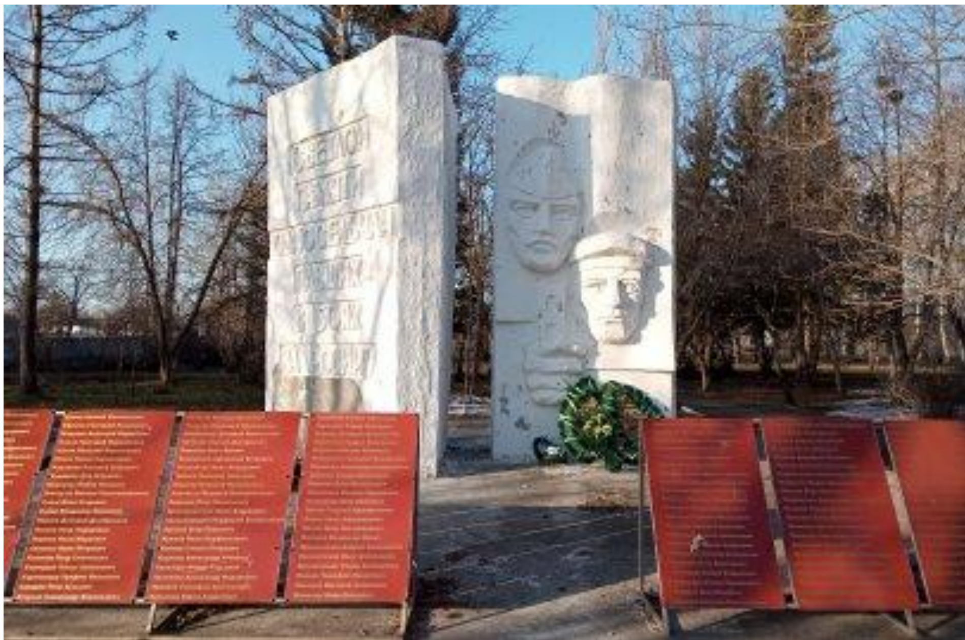
Мемориальный комплекс воинам, погибшим в годы Великой Отечественной войны, село Красный Яр