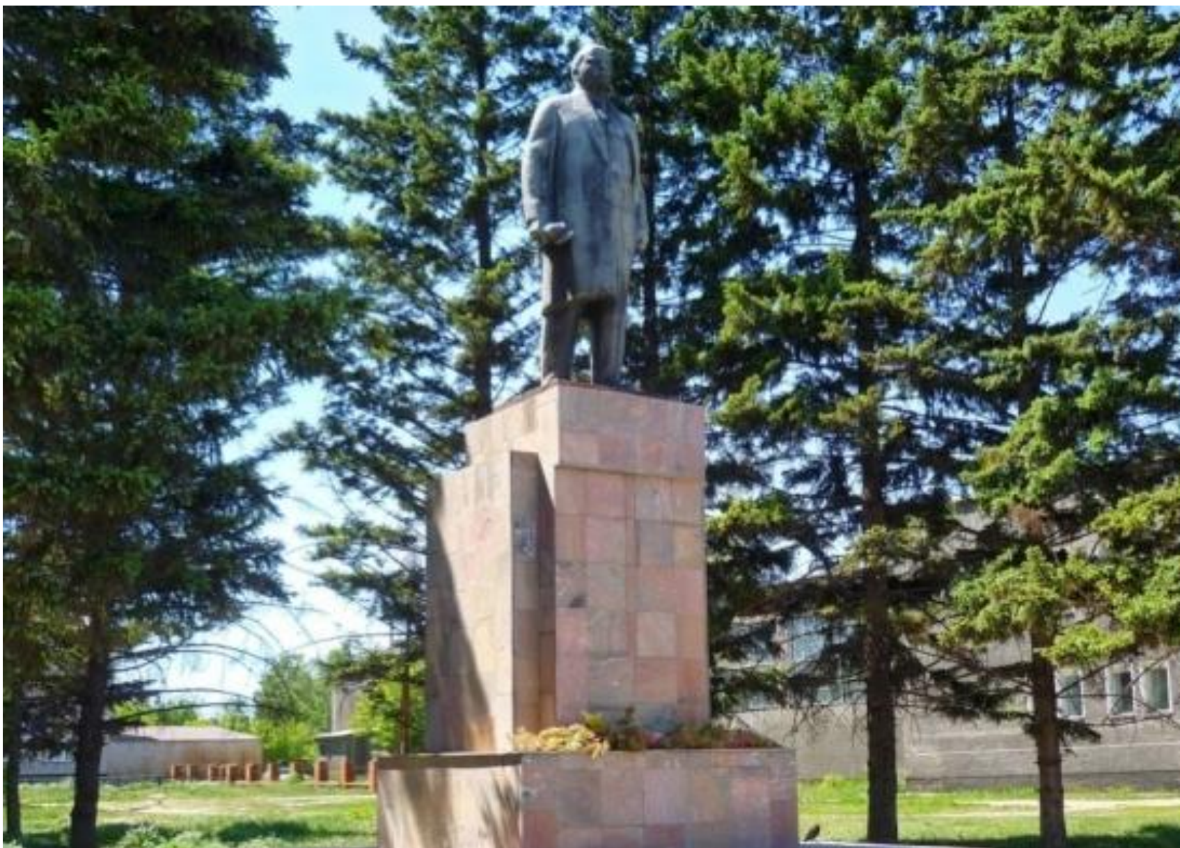
Памятник В.И. Ленину