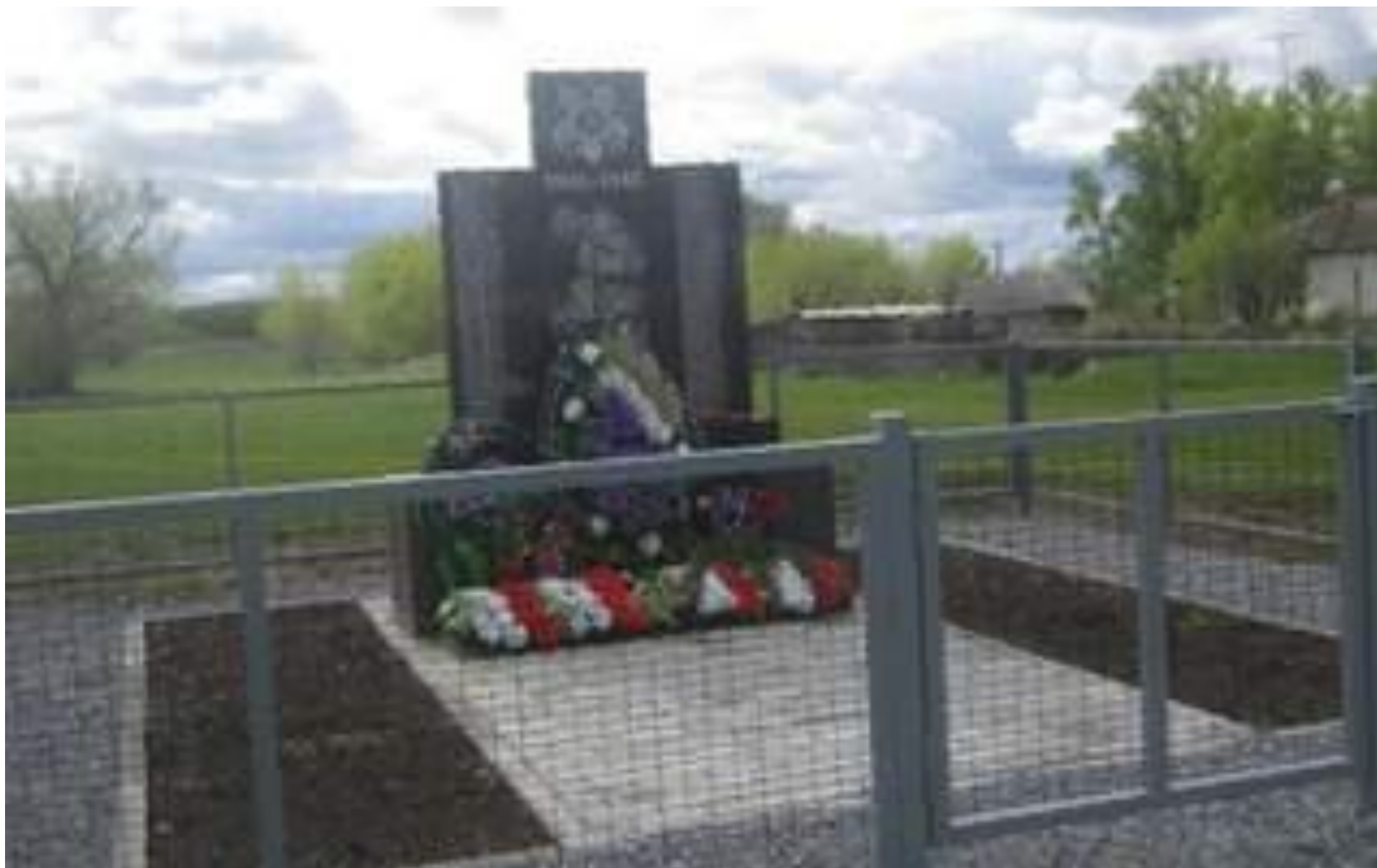
Обелиск воинам, погибшим в годы Великой Отечественной войны, п. Качусово