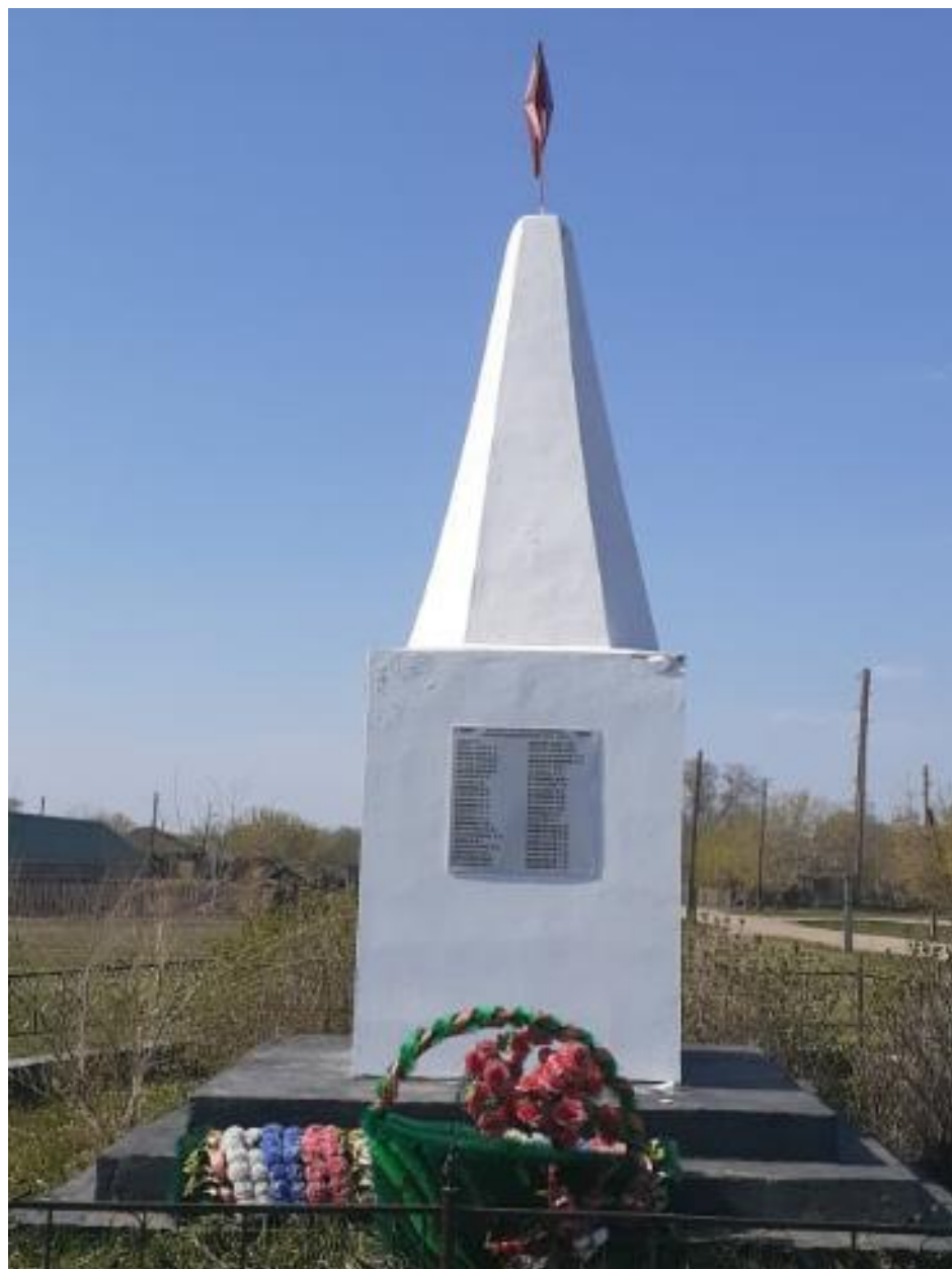
Обелиск воинам, погибшим в годы Великой Отечественной войны, поселок Воробьево