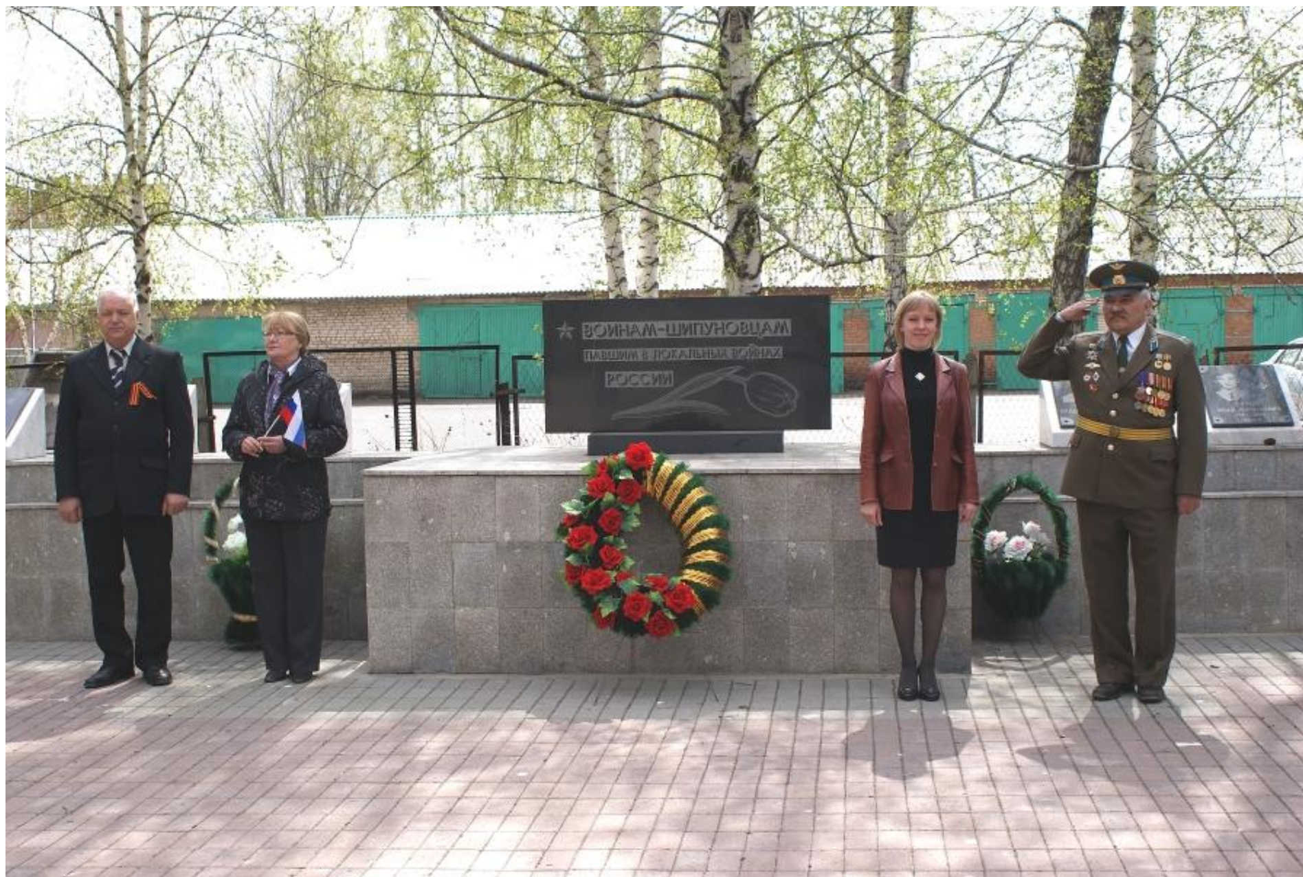
Мемориал «Черный тюльпан»