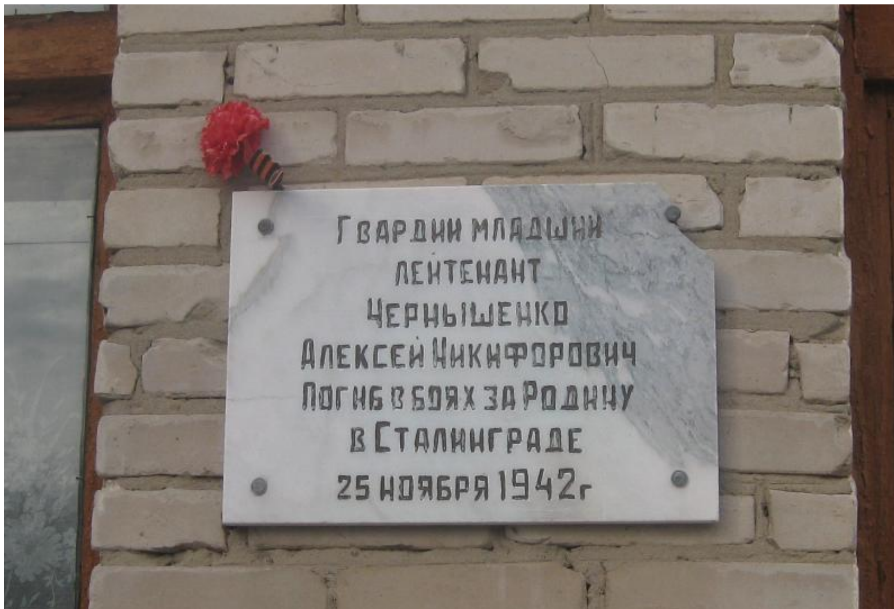
Мемориальная доска, с. Шипуново