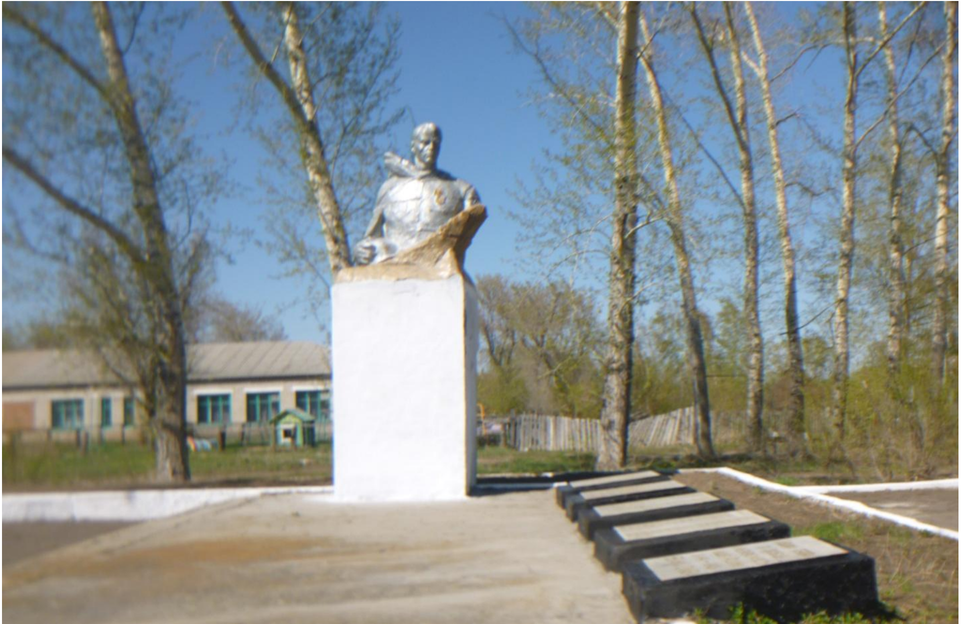
Мемориальный комплекс воинам, погибшим в годы Великой Отечественной войны, с. Порожнее