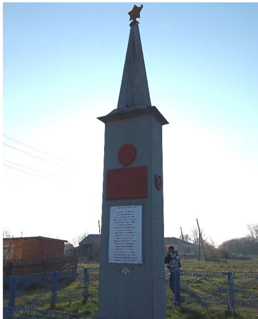
Обелиск воинам, погибшим в годы Великой Отечественной войны, поселок Чаячий