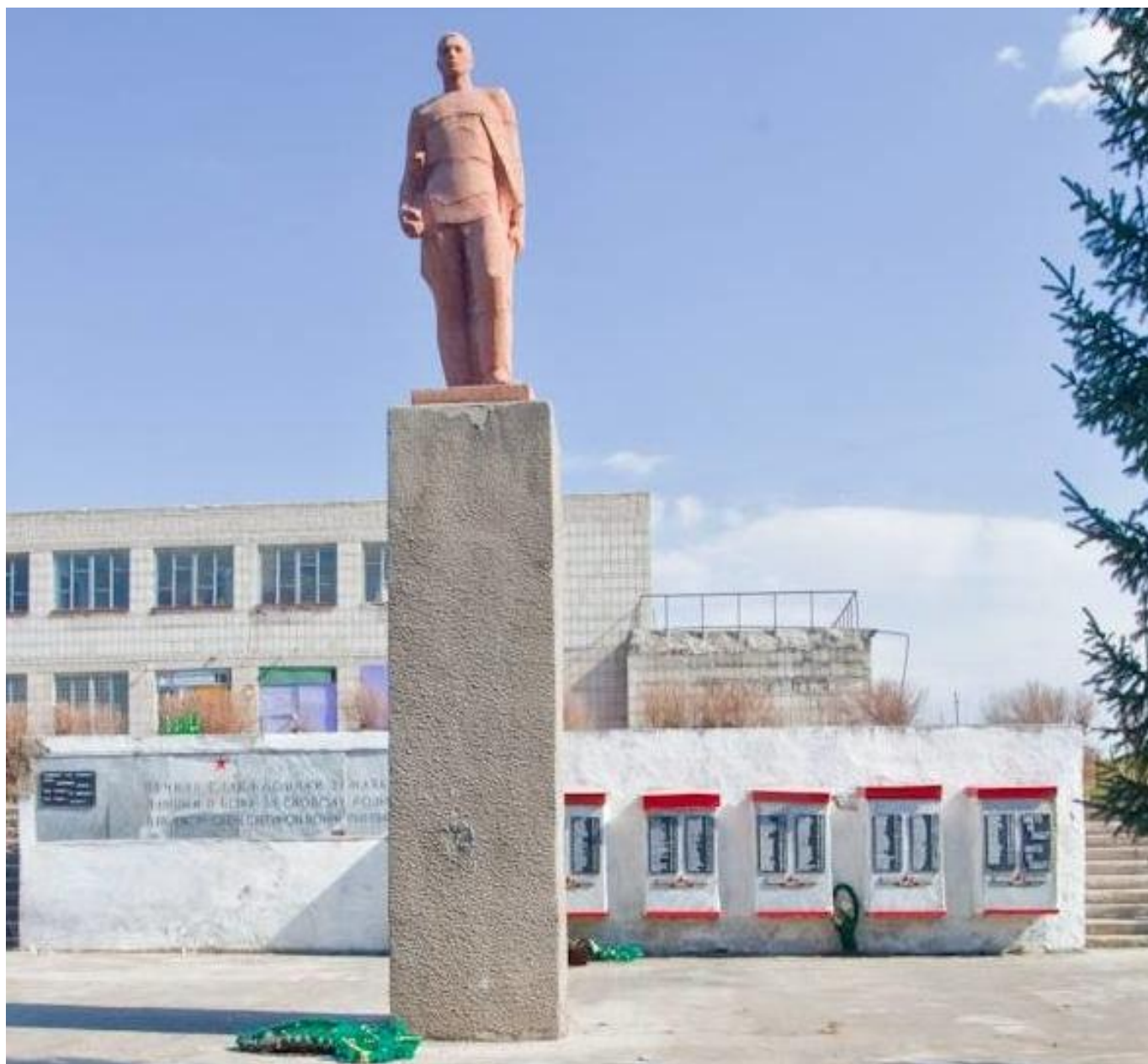
Мемориальный комплекс воинам, погибшим в годы Великой Отечественной войны, с. Зеркалы