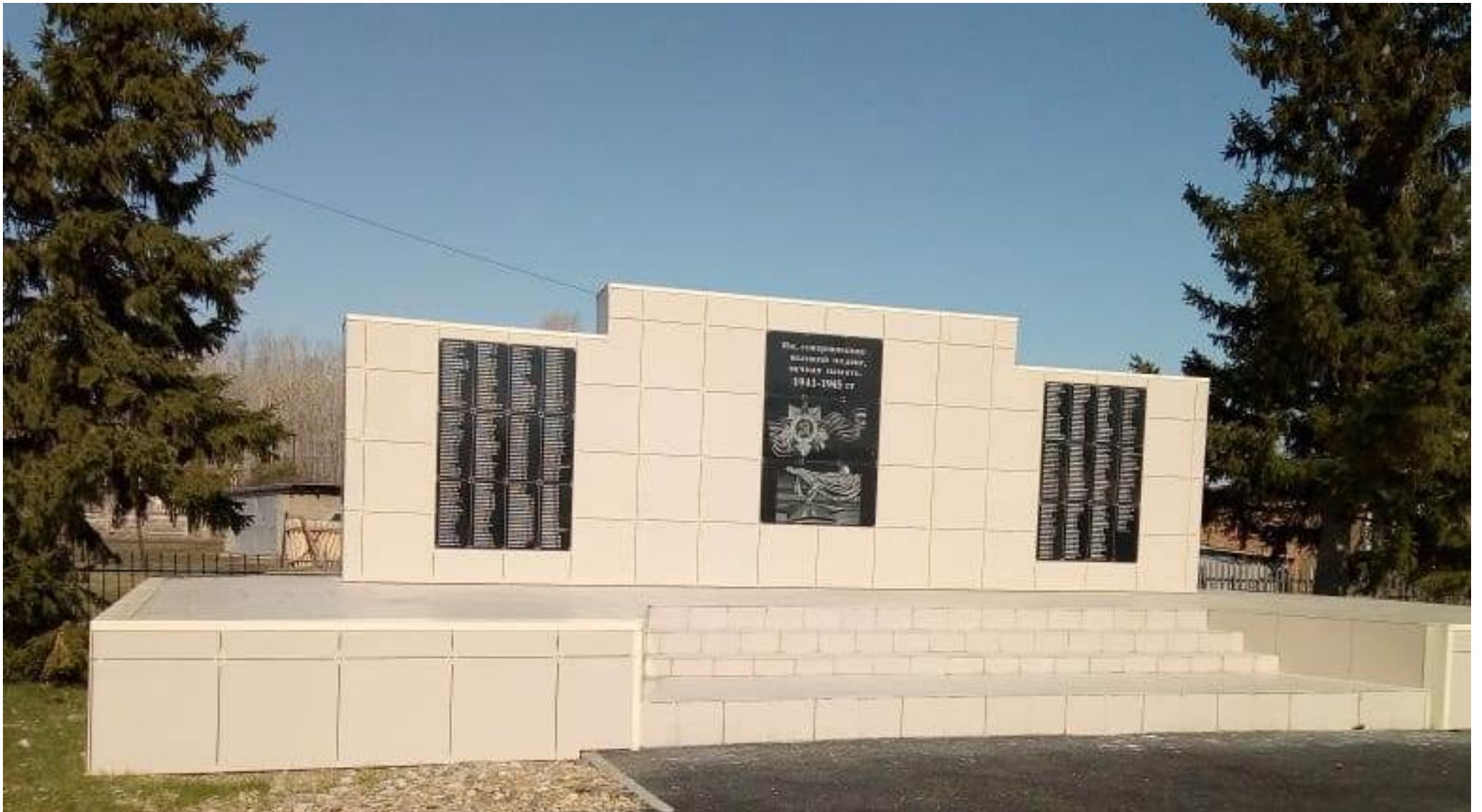
Мемориальный комплекс воинам, погибшим в годы Великой Отечественной войны, с. Ельцовка