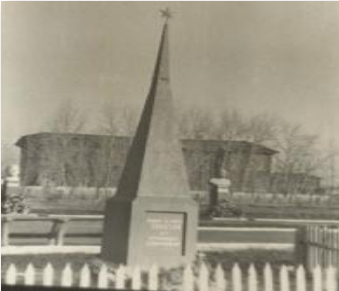
Памятник «Борцам, погибшим за Советскую власть»