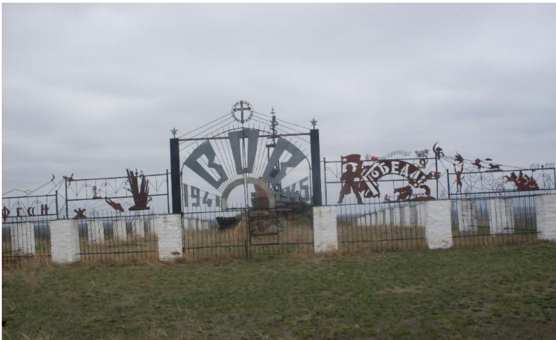
Мемориальный комплекс воинам, погибшим в годы Великой Отечественной войны, с. Белоглазово