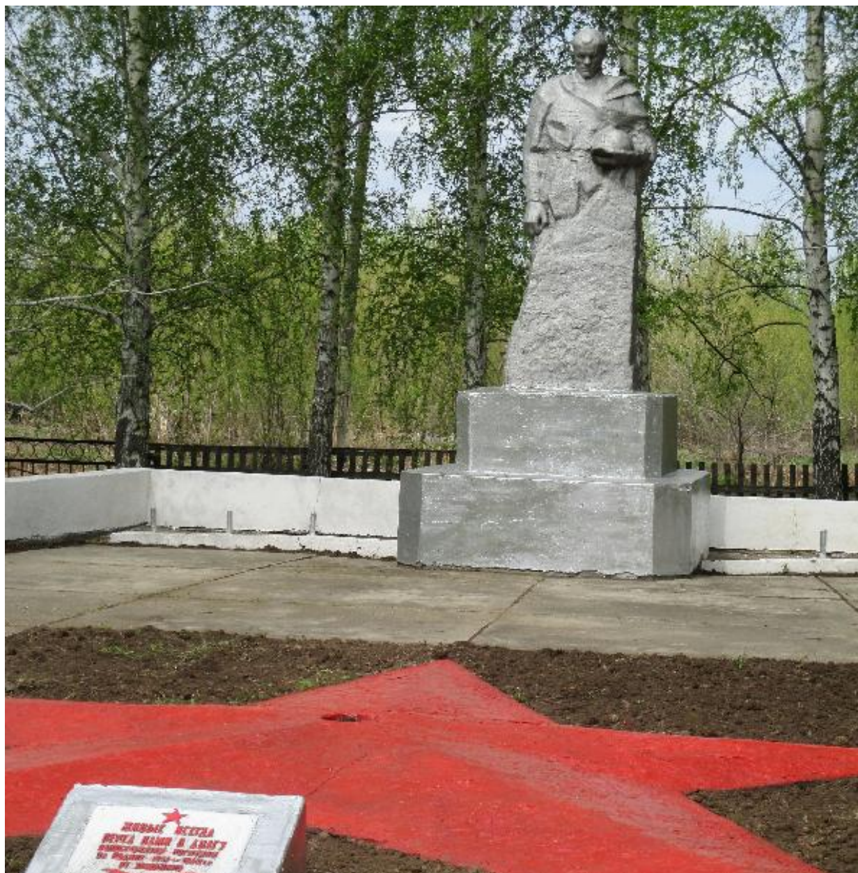
Мемориальный комплекс воинам, погибшим в годы Великой Отечественной войны, село Новоивановка