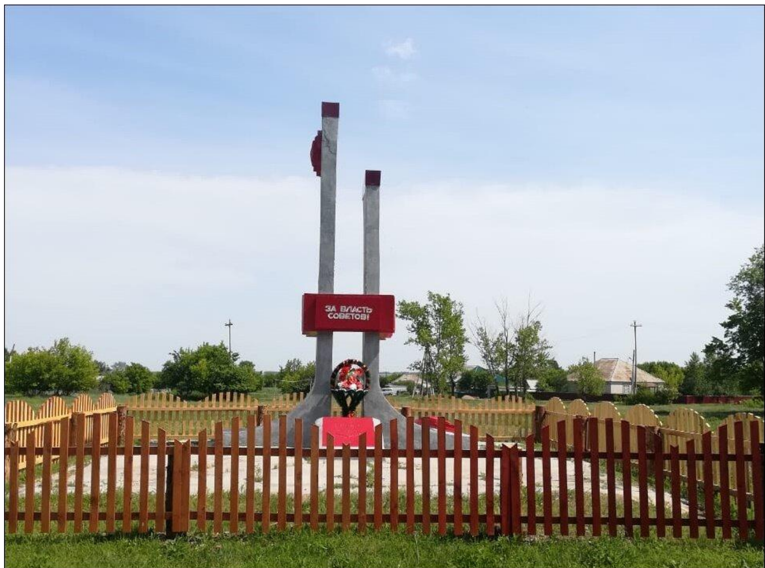
Колхоз «Россия», Шипуново-2. Памятник «За власть советов»