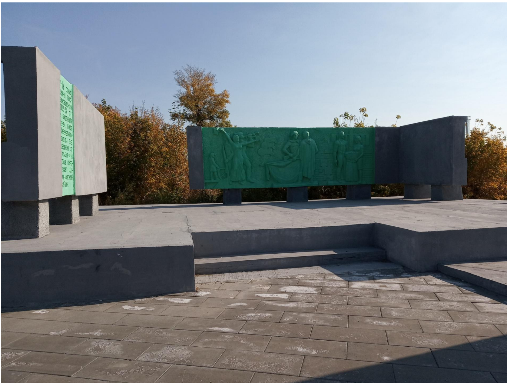
Памятник Трудовой Славы Шипуновского района, 2022 г.