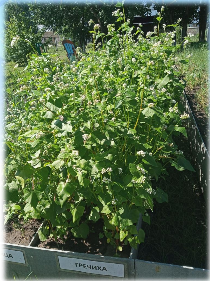
Подсолнечник и гречиха