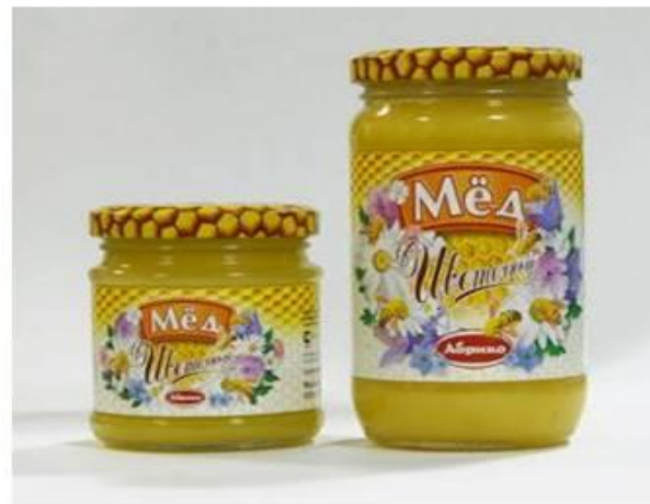
5. Банка с мёдом.