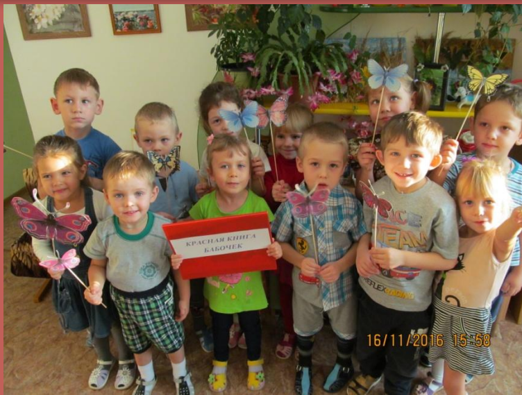
«Удивительный мир бабочек»