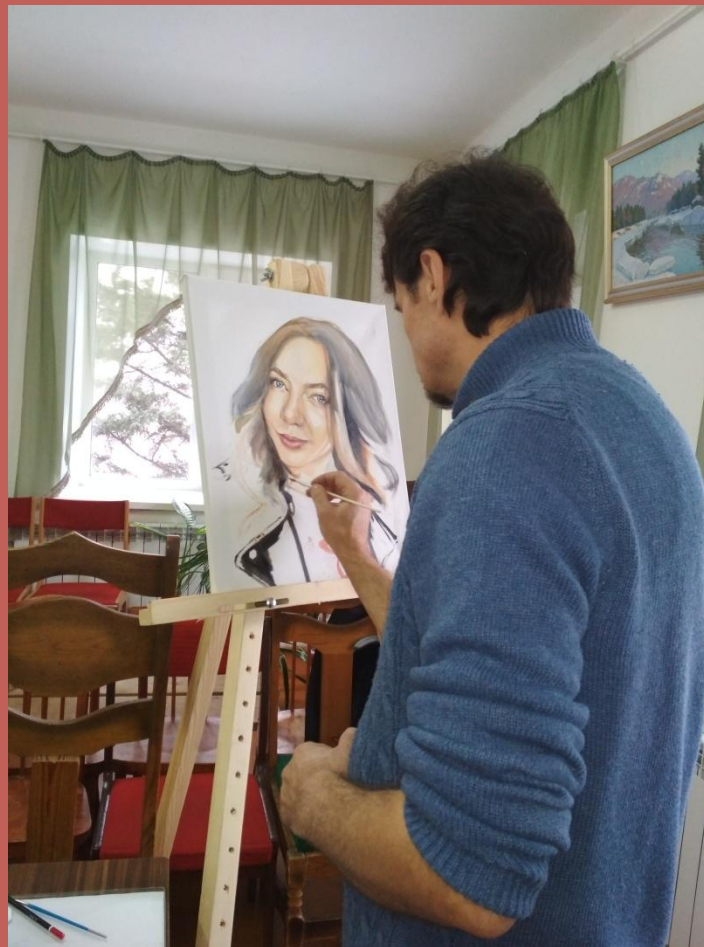
Знакомство с творчеством Г.А.Гикало