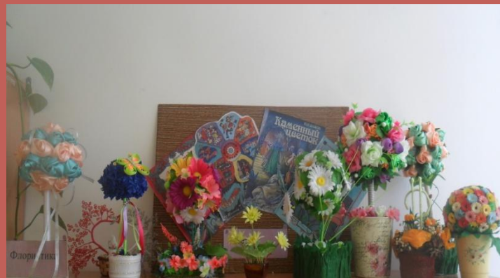
Выставка «Необычный цветок»