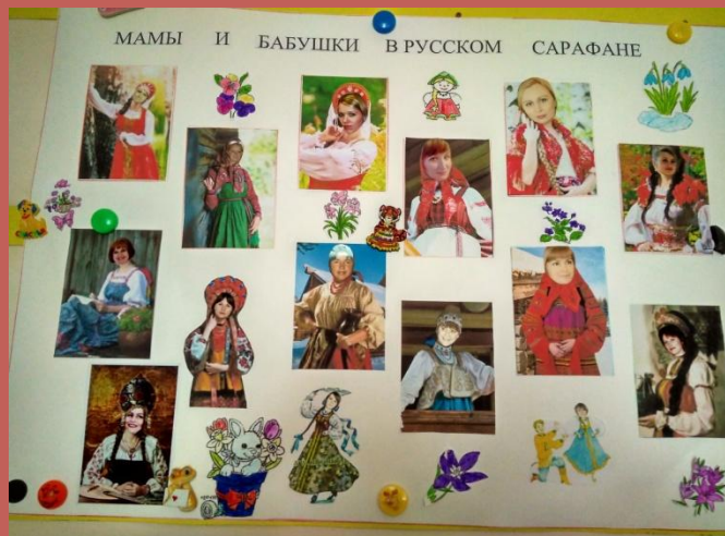
«Мама в русском сарафане»