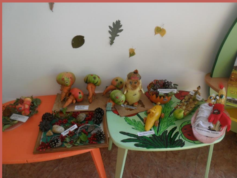
Выставка совместного творчества «Осенние фантазии»