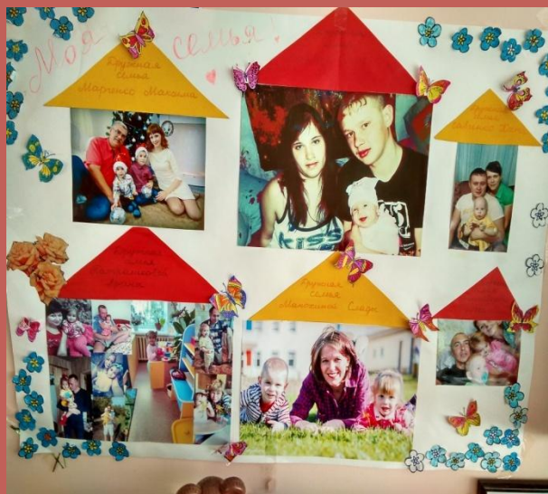
Уголок «Моя семья»

В детском садике узнали Мы прекрасные слова. Их впервые прочитали: Мама, Родина, Страна!