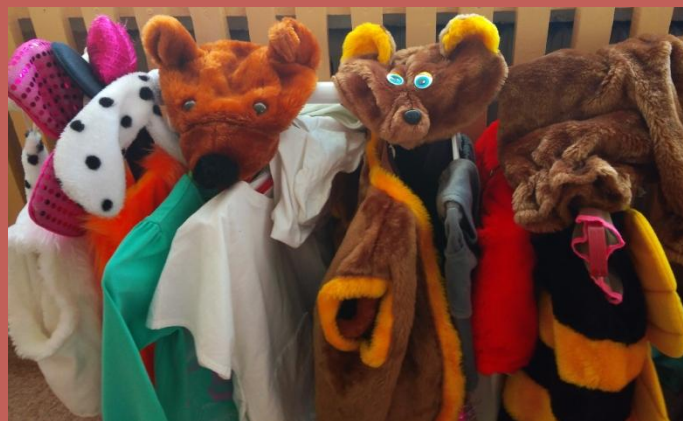
Пополнение уголка ряженья