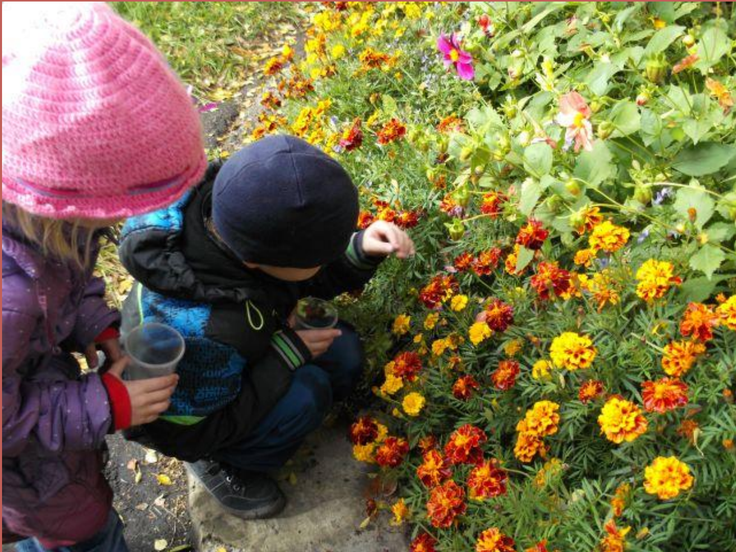
Наблюдаем за цветами