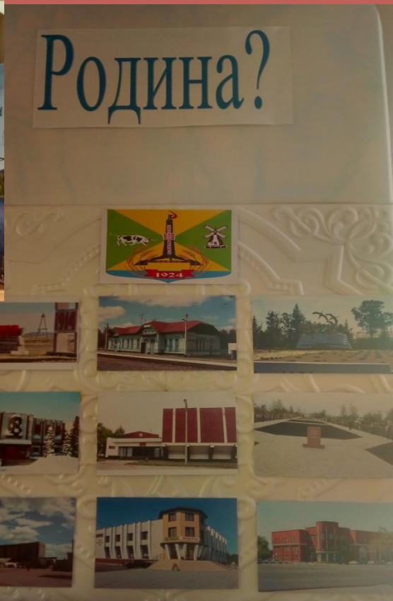
Уголок патриотического воспитания