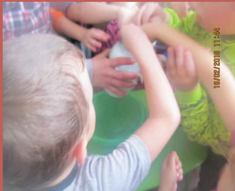
«Белый снег пушистый»