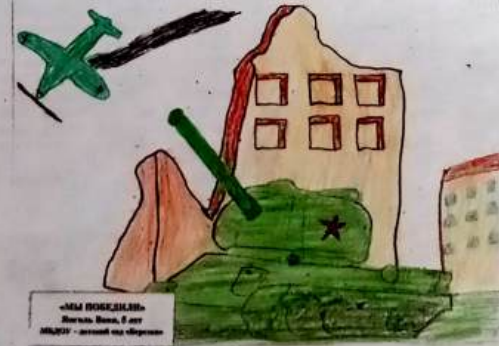
«Мы победили», Ваня Янголь, 5 лет.