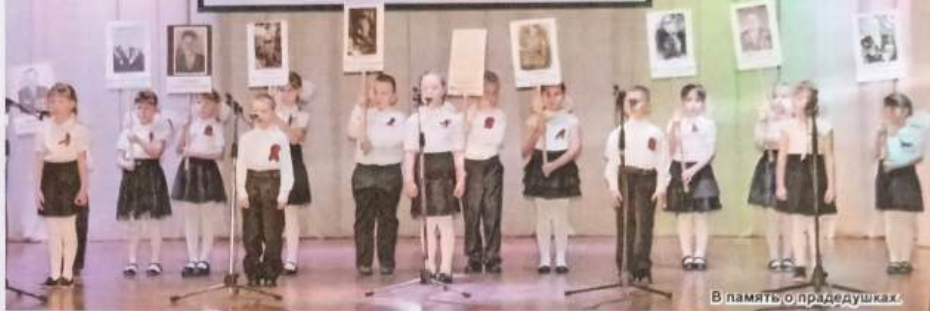
В память о прадедушках.