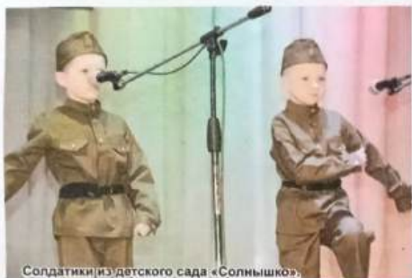
Солдатики из детского сада «Солнышко».

Навстречу 75-летию Великой Победы: воспитываем патриотов