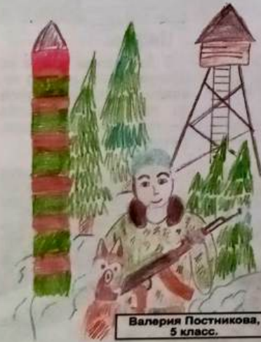
Валерия Постникова, 5 класс.