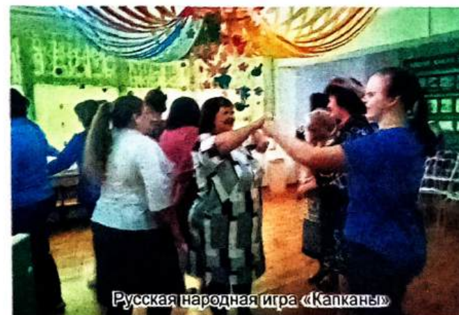
Русская народная игра «Капканы»