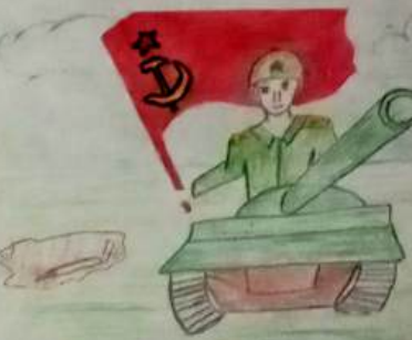
Ренат Шумаков, 5 класс.