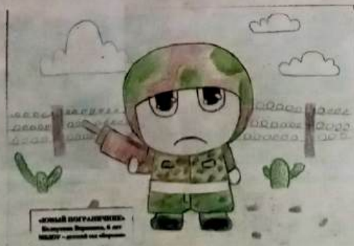
«Юный пограничник», Вероника Белоусова, 6 лет.