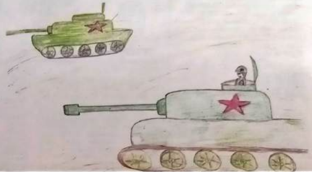
Софья Яковлева, 6 лет.