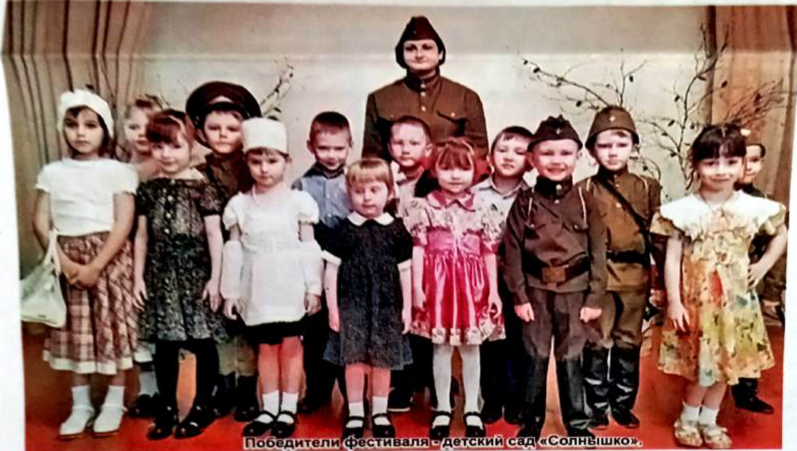
Победители Фестиваля - детский сад «Солнышко».