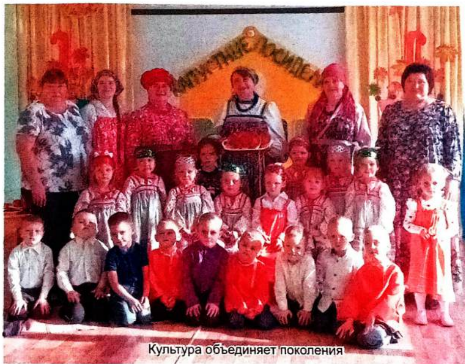
Культура объединяет поколения

Замечательным дополнением к празднику послужила выставка семейных работ под названием «Барыня - Капустка». Виновни-