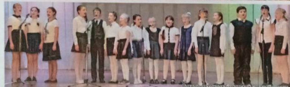
Вокальный ансамбль Быковской средней школы.