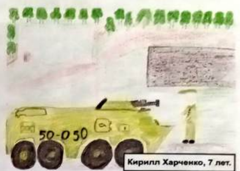
Кирилл Харченко, 7 лет.