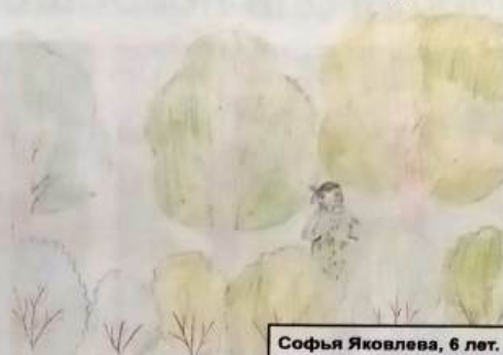
Софья Яковлева, 6 лет.