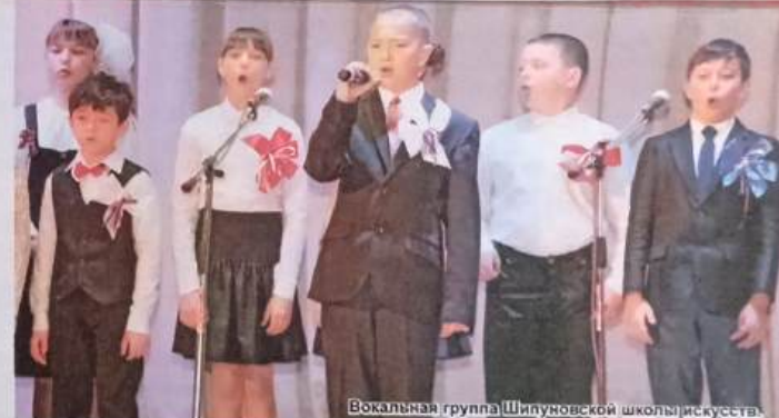
Вокальная группа Шипуновской школы искусств.