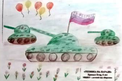
«Техника на параде», Егор Храмых, 6 лет.